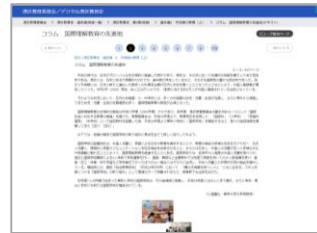
〈通史編・テキスト形式〉

2021年度刊行の『港区教育史』（通史編・資料編）を、テキスト形式／刊本形式で閲覧できます。 資料編は、グラフや表を多用し、港区の教育に関わるデータをまとめています。