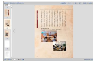
〈通史編・刊本形式〉