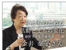
子どものための活動とまちの変化