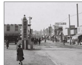
麻布十番商店街 昭和31年（1956年）