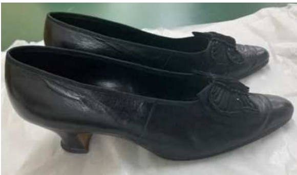
貞明皇后御靴（明治神宮ミュージアム）