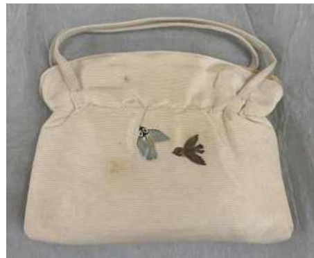
布製手提（明治神宮ミュージアム）