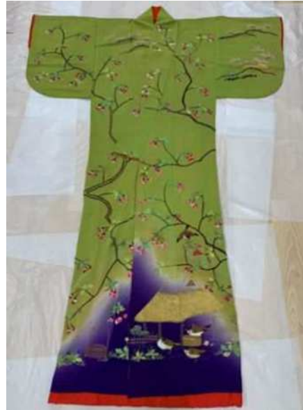
萌黄地桜花雀文小袖（円通寺）