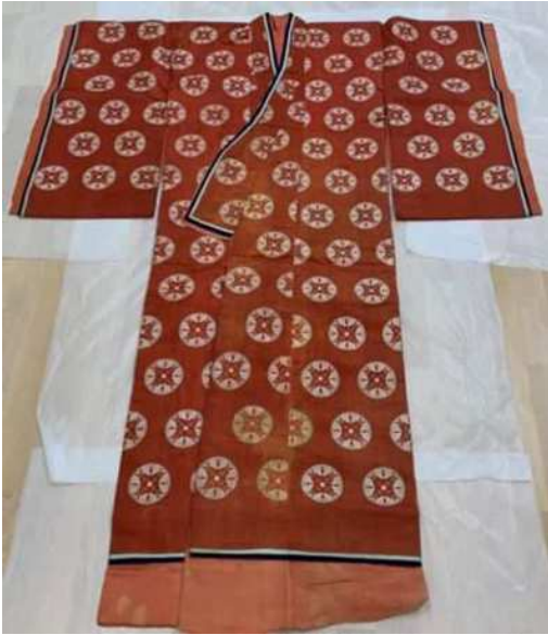
紅地浮線綾文袴（円通寺）