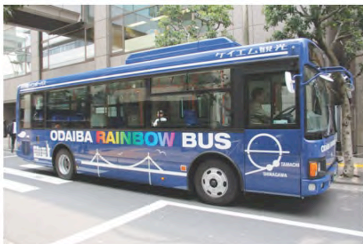
お台場レインボーバス

◆お台場レインボーバス(地域と事業者、区で構成する運営協議会において企画・運営、交通不便地域の解消)