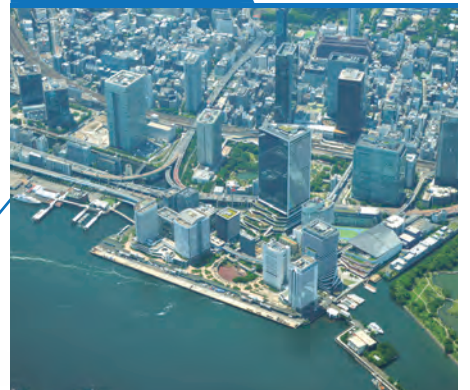
芝浦中央公園・高輪ゲートウェイ駅周辺