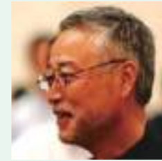
千葉大学名誉教授 赤坂 信