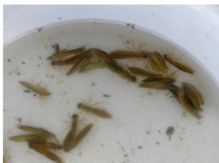
救出したヤゴ(ギンヤンマ)