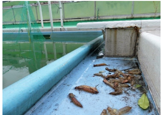
打ち上げられたヤゴとぬけがら