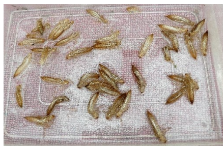
集められたギンヤンマのぬけがら