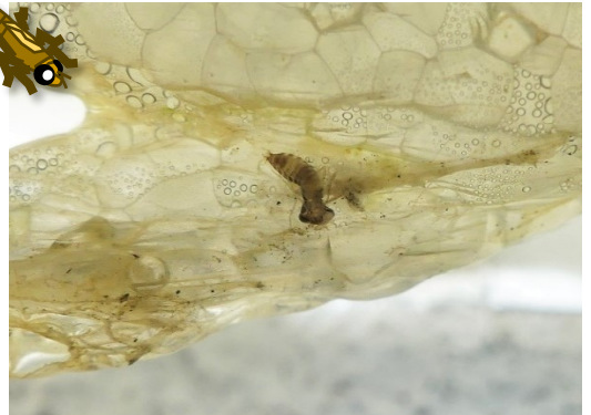
生まれたばかりのギンヤンマのヤゴ3mm