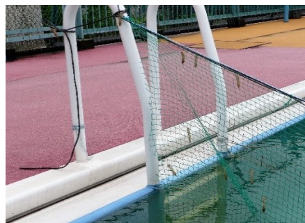
ネットに残ったぬけがら10匹(東町小)