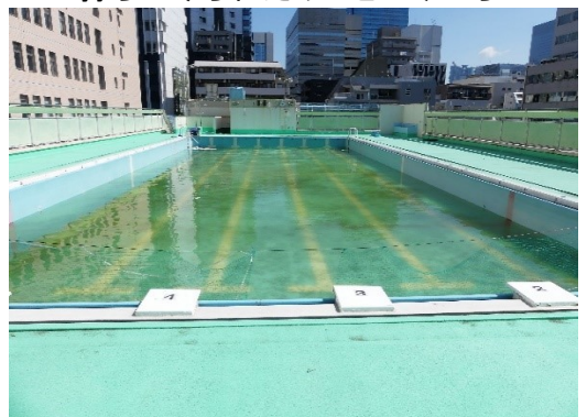
去年よりきれいに見えたプール