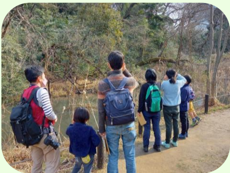
カワセミを発見！ すぐに飛んでいって しまいました…

※ムクロジの実にはサポニンという成分が含まれていて、界面活性作用があり、汚れを落とす効果があります。ペットボトルに水とムクロジの実を入れて振ると泡立ちます。