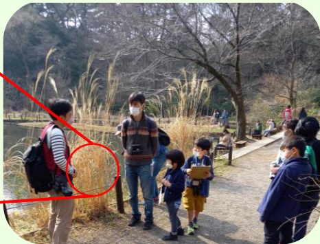
オオカマキリの卵を見つけました！