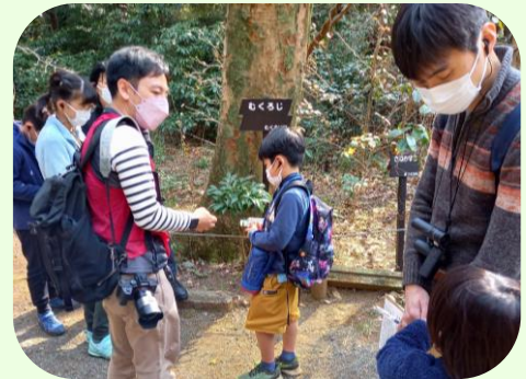
ムクロジの実で泡づくり体験！