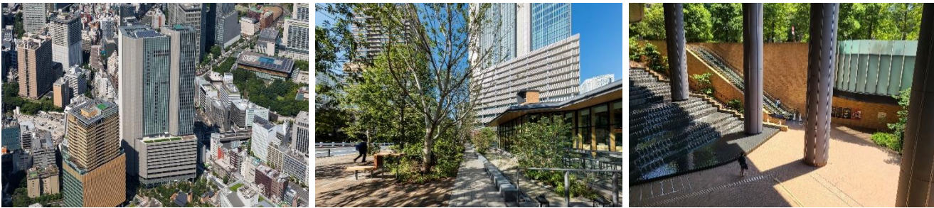
赤坂一丁目地区 (赤坂インターシティ AIR)

お忙しい中大変恐縮ですが、本アンケート調査の趣旨をご理解いただき、ご協力をお願いいたします。