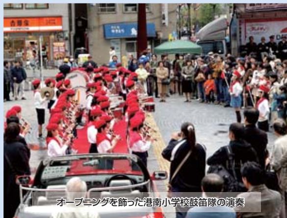
オープニングを飾った港南小学校鼓笛隊の演奏