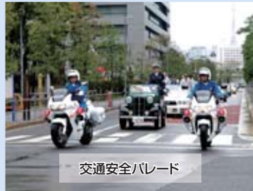
交通安全パレード

4月13日、品川駅港南口のふれあい広場にて、春の全国交通安全運動に合わせた恒例の品川クラシックカーレビューイン港南（主催：品川港南商店会・日本ダットサン会）が開催され、30台以上の往年の名車が集結しました。今回も、港南小学校の鼓笛隊の皆さんのみごとな演奏で幕を開け、続いて行われた交通安全式典では、高輪警察署長や港区長などのあいさつ、歌謡ショーなどがありました。その後は、来賓や港南小学校の皆さんなどが、クラシックカーに分乗し、交通安全を呼びかけながら、品川駅周辺でパレードを行いました。