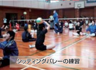
シッティングバレーの練習