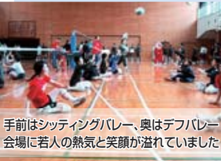
手前はシッティングバレー、奥はデフバレー会場に若人の熱気と笑顔が溢れていました