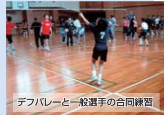
デフバレーと一般選手の合同練習