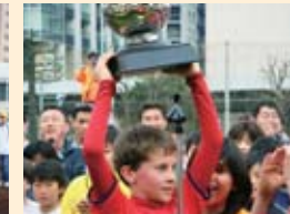
大健闘の台場FCのメンバー