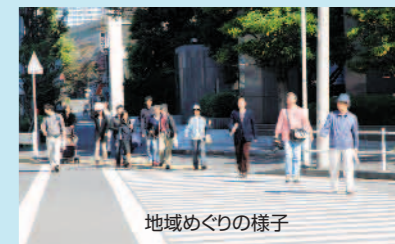
地域めぐりの様子

今年度は、ベイエリアブランド創出に向けた計画づくりについて検討を進めていきます。