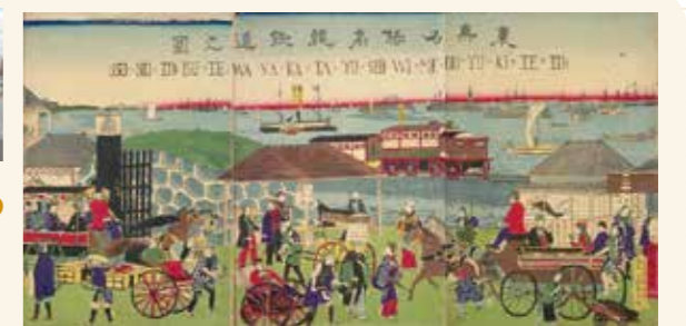
当時の最先端である蒸気機関車が海の上を走るのは、風光明媚で東京の名勝でした。広重「東京名勝高輪鉄道之図」(国立国会図書館ウェブサイト)