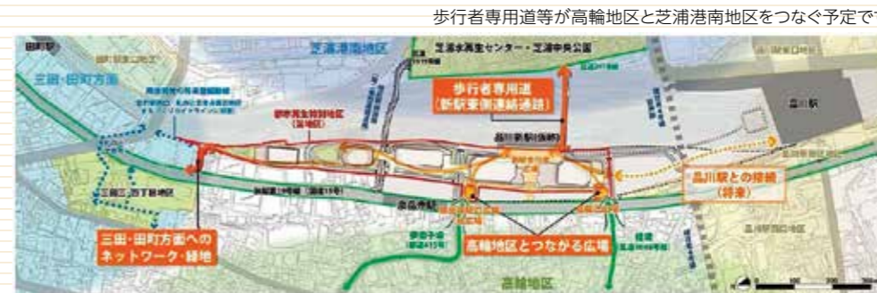
歩行者専用道等が高輪地区と芝浦港南地区をつなぐ予定です

第2期以降は品川駅側の開発も構想されており、将来的には品川駅(北口・西口開発予定有)との接続も計画されていますので、今後より周辺地域の発展が進むと考えられます。