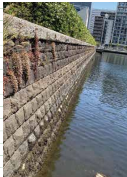
きれいに積み上げられた石(石積護岸アップ) Neatly piled stones (close-up of the embankment)