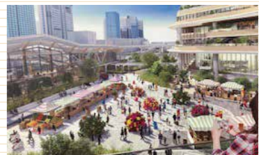
高輪ゲートウェイ駅周辺の開発イメージ