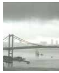
めるもさんの作品 「パイレーツオブカリビアン!？」

芝浦人さんの作品 バルコニー パパが主催の グランピング ベランダは ママが自慢の カフェテリア