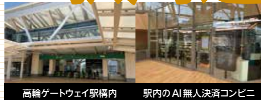
高輪ゲートウェイ駅構内