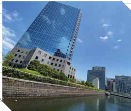
重箱堀からシーバンスを見上げてみます。今でも石積護岸を見ることができます。Looking up at the Seavans from Jyubako Moat. The stone embankments are still visible.

In the upcoming season, how about adding Jyubako Moat to your next walk as you think about the swimming beach of Shibaura?