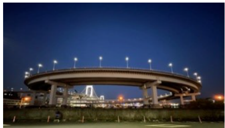
ponco2さんの作品 「レインボーブリッジのケーキ」

芝浦港南地区の人、暮らしを伝える作品をお送りください。応募方法は、作品にタイトルを添えて、住所・氏名・電話番号・作品の返却希望の有無・匿名またはペンネーム使用希望の有無を明記の上、べいあつぷ編集部までお送りください。写真はデータでもプリントでもOKです。携帯写真でも大歓迎です。読者のあなたが「べいあつぷ」を盛り上げてください。