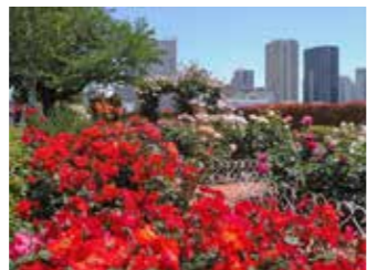
有馬仁志さんの作品 「薔薇香る芝浦中央公園(1)」