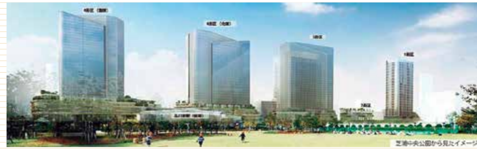
芝浦中央公園から見たイメージ