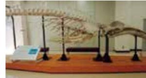
本館のドワーフミンククジラ

東京海洋大学品川キャンパス内にある「マリンサイエンスミュージアム」は、海の生き物標本、漁法や水産物の加工法などを楽しく見ながら学べるミュージアムです。