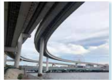
橋と有明ジャンクションと観覧車