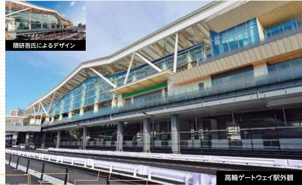
隈研吾氏によるデザイン

令和2年(2020年)3月14日、49年ぶりに山手線30番目の新駅として開業した高輪ゲートウェイ駅は芝浦港南地区への玄関口でもあります。開業から1年ほど経った現在、駅と街はどのように変化したのか、現在と過去・未来について迫ります。