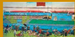
複数箇所に設けられた鉄道線をくぐる水路のひとつが高輪橋架道橋の前身と考えられる。三代歌川広重「東京品川海辺蒸気車鉄道之真景」(慶應義塾所蔵)

実はこのトンネル、大正期に海上に開通した東海道線が海岸と海とを隔てることを防ぐため、舟が通行できるように設けられた水路だったものなのです。このトンネルは、開発により無くなってしまいましたが、海があった頃の昔に思いを馳せてみたくなってしまいましたね。