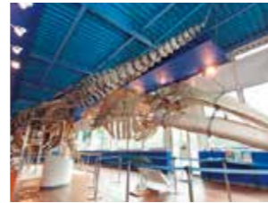
鯨ギャラリーに展示されている体長17.1m、体重67.2トンの世界最大級のセミクジラ(左)の骨格標本

2階展示室に入るとすぐに目を引くのは南極にいる生き物のはく製たち。今にも動き出しそう!!