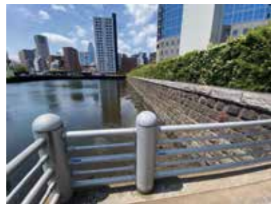
シーバンス側から見た重箱堀と南浜橋(左奥) Jyubako Moat and Minamihama Bridge as seen from the Seavans side (back left)