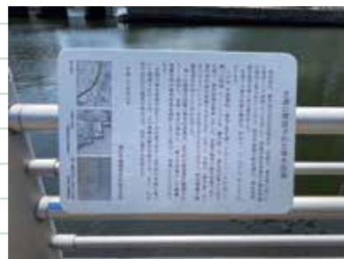
芝浦海水浴場に関する説明 Explanation of Shibaura Beach