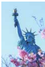
ぼちやまるさんの作品 「待ちわびた春」