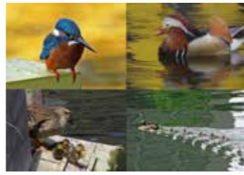
盛 満利さんの作品 「アイランドの野鳥01」