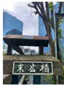
力強い字体の橋名

末広橋は、芝浦運河にかかる8本の橋の1つで、ゆりかもめ日の出駅とシーパンスを結んでいます。