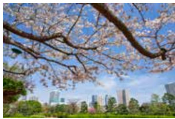
ゆきえもんさんの作品 「元気が出てくる桜の風景」