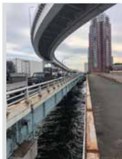
歩道と車道が分離されている

日中は車の往来が多い橋ですが、橋の周辺をじっくり眺めてみると、新都橋すぐ近くに架かっているのぞみ橋や有明橋、上空を覆っている首都高速有明ジャンクションなどの道路建築物は幻想的で、一見の価値があります。また、朝、昼、夜それぞれ違った雰囲気を感じられる橋のため、近くを訪れた際は、ぜひ立ち寄ってみてください。