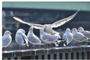
ニコちゃんさんの作品 「そこ退けて」