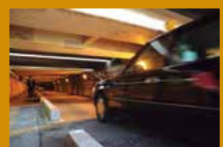
令和2年(2020年)3月に撮影した、開発直前の高輪橋架道橋。現在は自動車を通ることができません