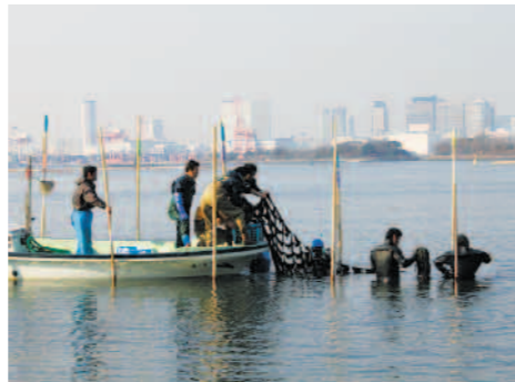
2月5日 海苔網引き上げ

また、ひび立ての際にお台場環境教育推進協議会の方の講演、中間刈り取りでは押し葉づくり体験、本刈り取りでは海苔の佃煮づくり教室を併せて行いました。