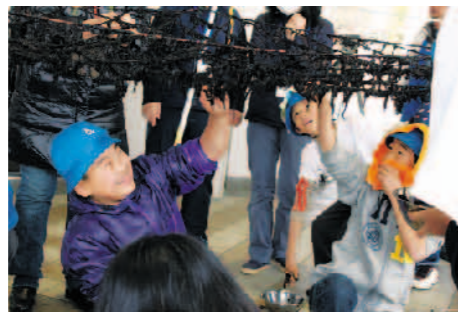
2月5日 海苔摘み取り