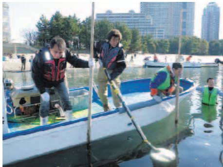
1月22日 中間刈り取り