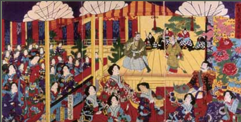
紅葉館舞台開ノ図 楊州 周延 明治14年(1881) Kōyōkan-butaibiraki-no-zu An Ukiyoe by Yōshū Chikanobu, 1881

紅葉館は、東京大空襲により焼失し、 現在跡地には東京タワーが建っています。 Kōyōkan was burnt down at the time of the Tokyo Air Raid; at present the Tokyo Tower stands on the site.