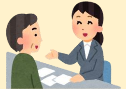
役所や銀行の手続き