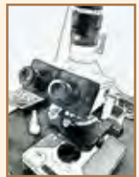
バクテリアを顕微鏡観察