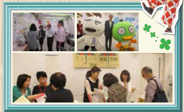
親子で考えよう食品ロス