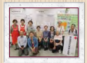
港区消費者団体連絡会の皆さん