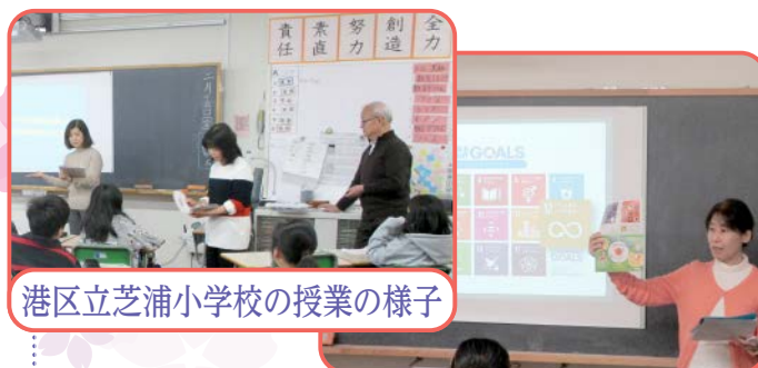
港区立芝浦小学校の授業の様子

家庭科の授業案作りのお手伝いとして、教材の紹介を行いました。区内の大学で実際に起こったトラブルのロールプレイを取り入れたテンポの良い授業でした。トラブルにあった時の連絡先として消費者センターを紹介してもらいました。