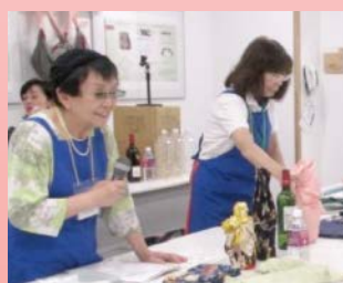
風呂敷の包み方講座

町会・自治会等の集まりに出向き、勉強会を開催したり、啓発冊子や講座のチラシを配布して、消費者センターをPRしていただく活動です。