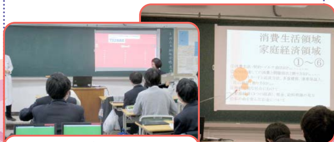
都立三田高等学校の授業の様子

家庭科の授業で「食品ロスとSDGs」に関する出前講座に行きました。国際色豊かな港区ならではの授業ということで、グローバルな視点から食品ロスを削減することの重要性をお伝えし一人一人が取り組めることを考えてもらいました。