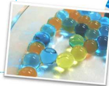
添加物で作る人工いくら