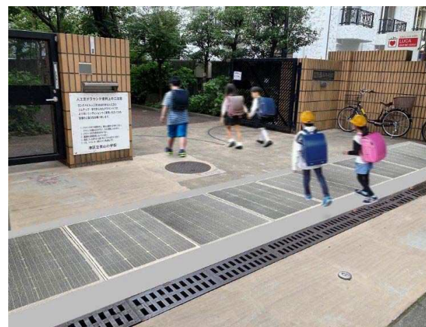
青山小学校(正門)の設置イメージ

台風などの暴風時にも壊れず、雨でも滑らない、最先端の再生可能エネルギーシステム。