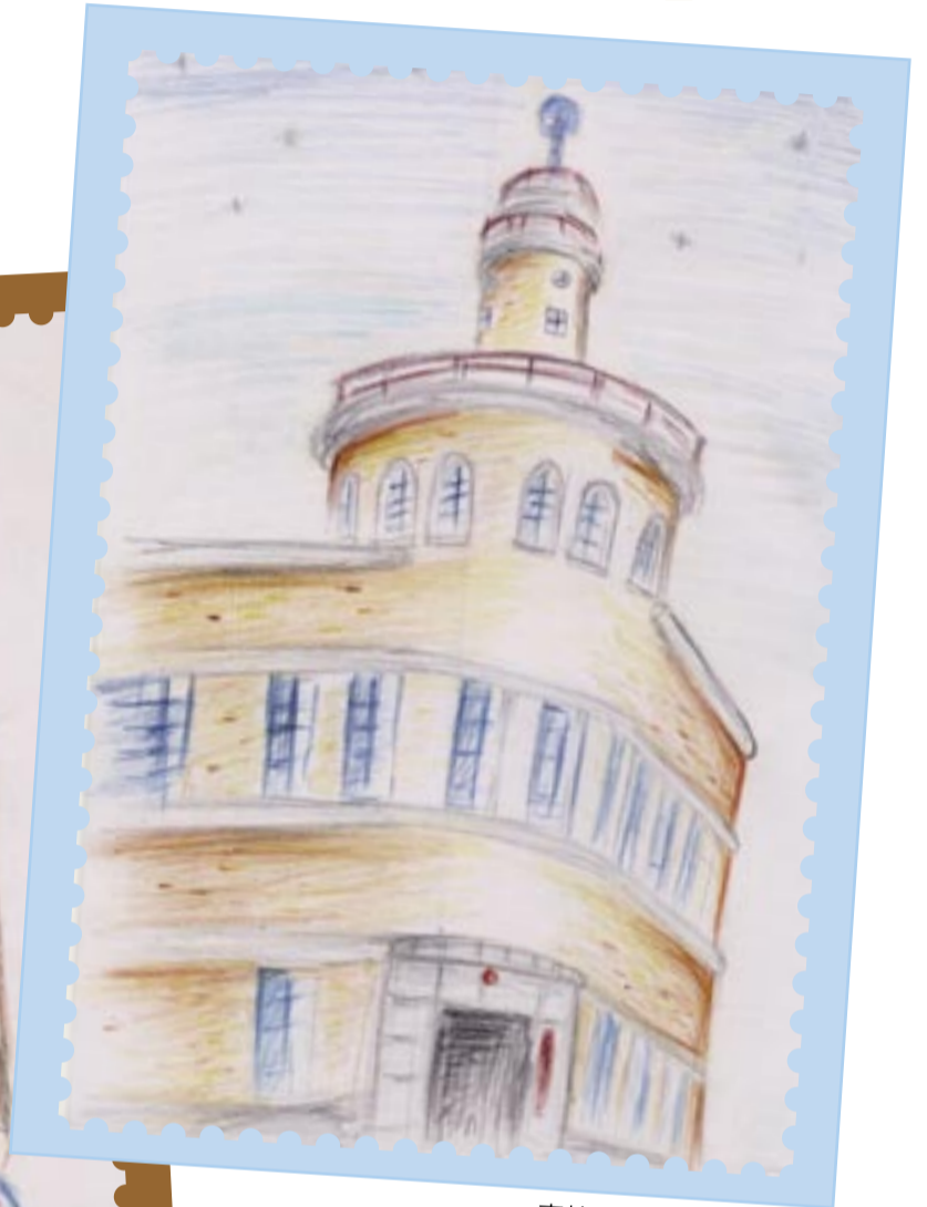
高輪消防署二本榎出張所