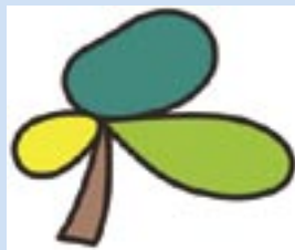
あっぷリング高輪ロゴマーク

平成19年12月 14日(金) 展示 午前10時～午後7時 15日(土) 展示 午前10時～午後7時 舞台 午前10時～午後4時 お店 午前10時～午後4時 16日(日) 展示 午前10時～午後4時