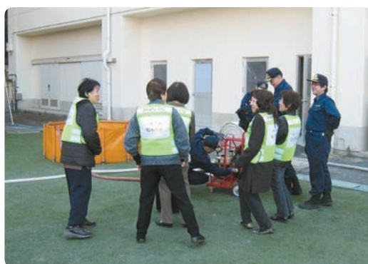
【平成20年3月松ヶ丘主催防災訓練の様子】