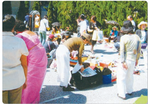
【フリーマーケット 町会員以外の方も出店できます】