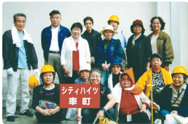
【港区合同防災訓練参加】 (高松中学校グラウンドにて)

その他、自治会独自の行事ではありませんが稲荷神社のお祭りや泉岳寺前児童遊園で行われる盆踊りにも参加しています。