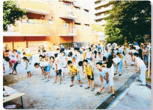
【プレイロッドでのラジオ体操】