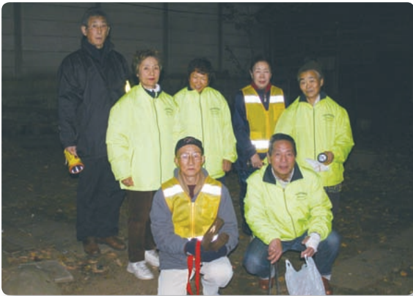
【町会役員のパトロール】

毎年秋に旧高松宮邸前広場をお借りして催されるフリーマーケットは、会員はもちろん、一般の方も出店できます。毎回 30 ブースぐらいの出店があります。ここ数年はお天気も味方して、とてもにぎわい、良い交流の機会となりました。まずは一度会場にお越しください。