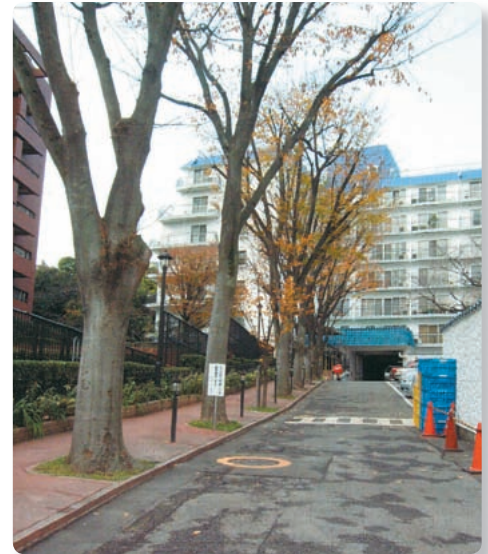
【ケヤキ並木】 (秀和高輪自治会の環境と住宅の容姿)

秀和高輪自治会は世帯数が200戸あり、1979年4月に「秀和高輪自治会」として発足しました。今までは持続性のある伝統的な自治会行事はなく、今後の課題であると考えます。現在取り組みつつある自治会の行事は、生活に直接関連のある活動を企画し実践しています。