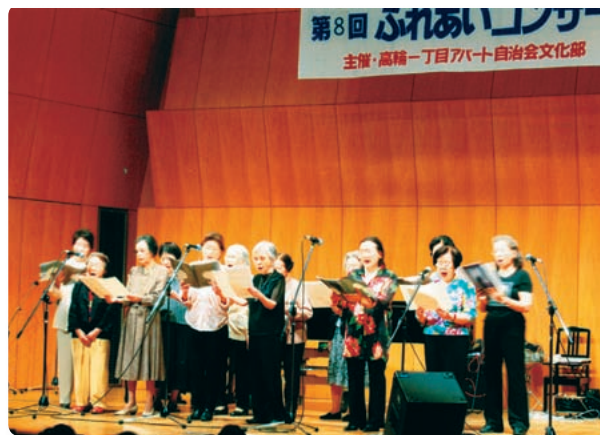
【ふれあいコンサート】