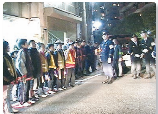
【子どもたちと歳末夜警】