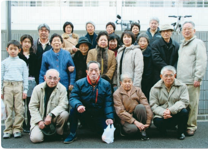
【新年賀詞交歓会の折の集い】