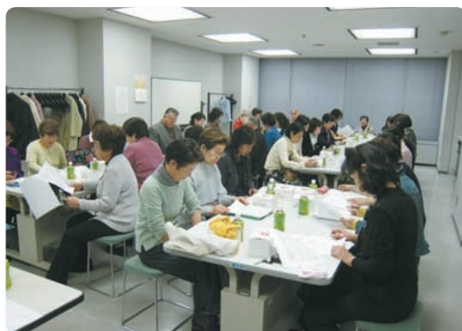
【平成20年4月定期総会の様子】

平成20年度から、防災組織を強化し、防災活動に力を入れており、火災警報器購入とりまとめ、防災センター見学、松ヶ丘主催防災訓練を実施する予定です。