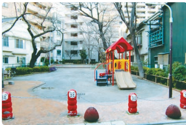
【三田松坂児童遊園】

結束の固い我が町では、昭和3年に、町所有の会館を造りました。また、昭和11年には200坪近い空地进行、有志が自前で借り受け松坂公園を造園し、子供相撲大会やラジオ体操の会場として活用され、会館とともに町の結束を大いに盛り上げました。