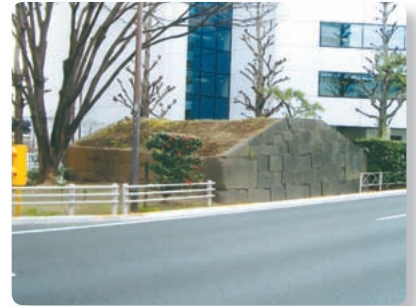
【「江戸名所図会」の高輪大木戸と現在の「史跡高輪大木戸趾」】

などに見受けられます。また、重量物運送に携わる牛車を扱う業者が町をなし、俗に高輪牛町と呼ばれました。浄土宗願生寺（高輪2丁目16番）には牛供養塔が残されており、平成20年度には「牛供養塔及び二千七百六十人之霊供養塔」が港区指定有形文化財（歴史資料）に指定されています。