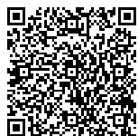
①電子申請 二次元コード