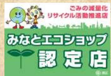
認定ステッカー（イメージ）