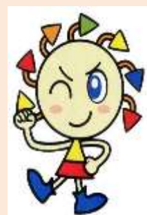
港区リサイクル キャラクター エコル

【問合せ・申込み】 港区 みなとリサイクル清掃事務所 ごみ減量推進係 〒108-0075 港区港南3-9-59 電話 03-3450-8025(代) FAX 03-3450-8063