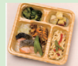
カロリー塩分調整食