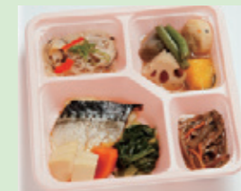
たんぱく質調整食