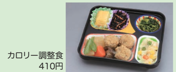
カロリー調整食 410円