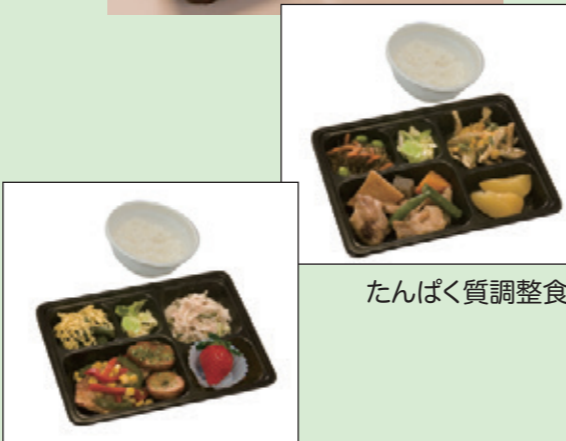
たんぱく質調整食