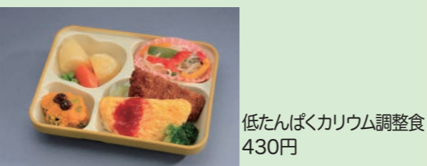
低たんぱくカリウム調整食 430円