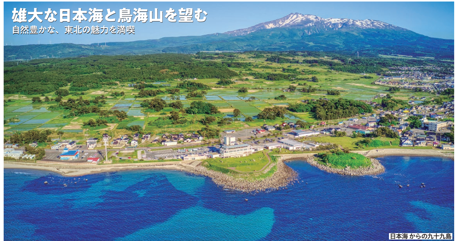
日本海からの九十九島