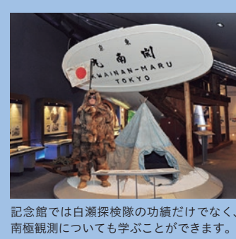
記念館では白瀬探検隊の功績だけでなく、南極観測についても学ぶことができます。