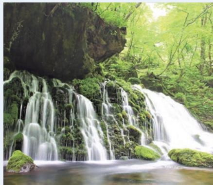
魅力2 元滝伏流水 水と苔のコントラスト (象潟町関字元滝)

牧草地や湖沼、草花が咲き誇る高原で、シンボルでもある鳥海山、そして日本海を一望できます。令和2年10月には新たに南展望台が整備されました。