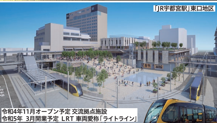
「JR宇都宮駅」東口地区

令和4年11月オープン予定 交流拠点施設 令和5年 3月開業予定 LRT 車両愛称「ライトライン」