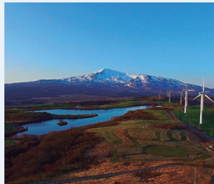
魅力1 仁賀保高原 鳥海山、日本海を一望 (仁賀保高原南展望台：畑字中ノ森)