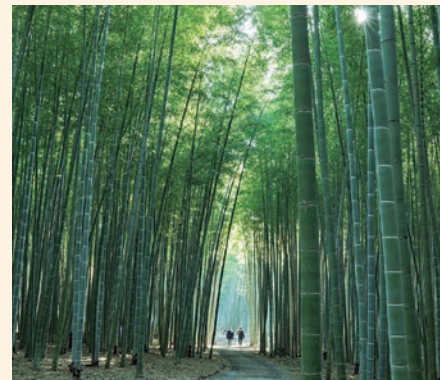
魅力1 若竹の杜 若山農場 日本有数の竹林で時を忘れる (宝木本町2018) ☎028-665-1417