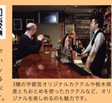
3種の宇都宮オリジナルカクテルや栃木県産とちおとめを使ったカクテルなど、オリジナルを楽しめるのも魅力です。