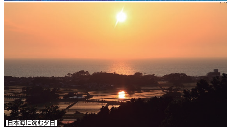
日本海に沈む夕日