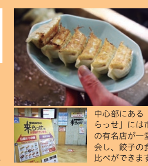
中心部にある「来らっせ」には市内の有名店が一堂に会し、餃子の食べ比べができます。