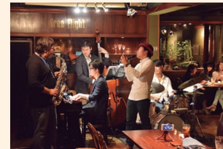
魅力3 ジャズの街 有名ジャズプレイヤーを輩出

大谷石は加工がしやすく、防火に優れることから全国で使われてきました。大谷資料館では採掘場跡を見学できます。壮大な空間は圧巻です!