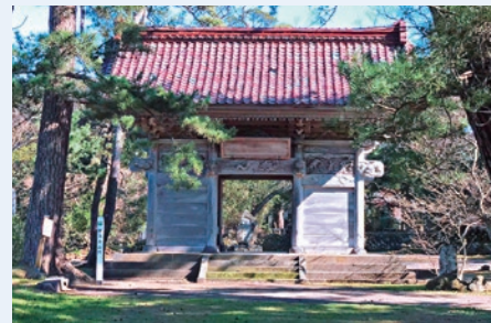
魅力3 蛸満寺 芭蕉も訪れた古刹 (象潟町字象潟島2)

雨や雪など、長い年月をかけて磨かれた鳥海山の伏流水が岩肌から吹き出しています。苔むした岩との対比が神秘的で、平成の名水百選に選ばれています。