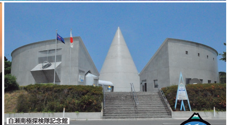
白瀬南極探検隊記念館