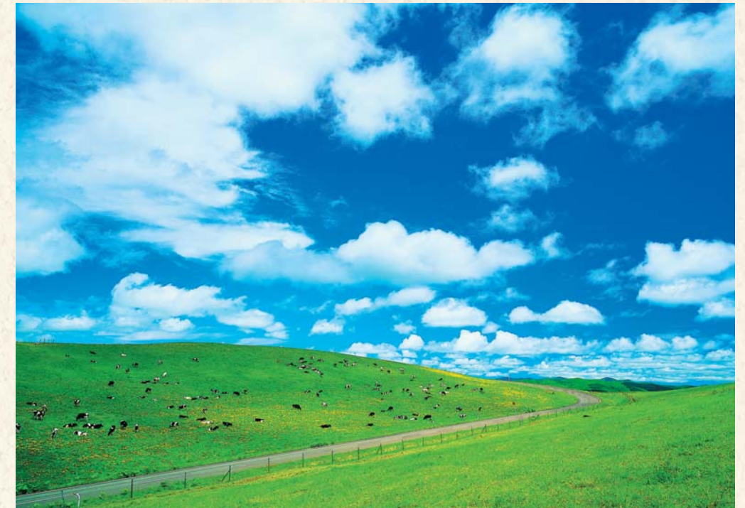
↑大規模草地牧場/草地牧場の総面積は1500ha。なんと東京ドーム約320個分の広さで、日本有数の規模を誇っています。約1500頭の乳牛が放牧され、のんびりと草を食べています。 →大規模草地牧場からの天の川/町の自慢は大規模草地牧場から見る夜空。天の川に手が届きそうです。もちろん1年中、観ることができますよ。