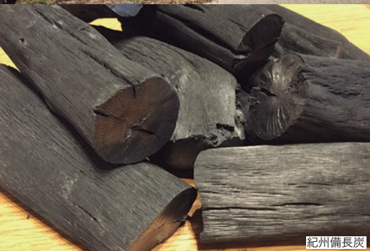
紀州備長炭 南高梅