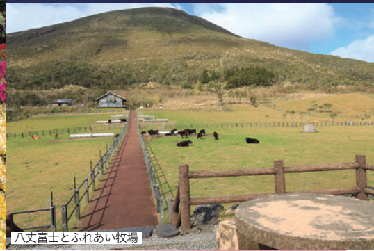
八丈富士とふれあい牧場