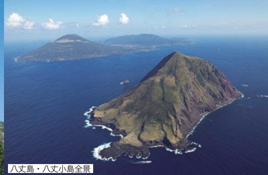
八丈島・八丈小島全景