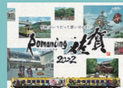
© SQUARE ENIX CO., LTD. All Rights Reserved. ILLUSTRATION: TOMOMI KOBAYASHI