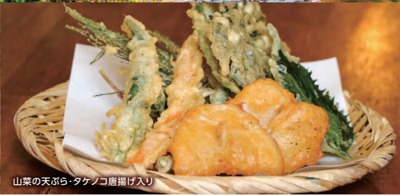
山菜の天ぷら・タケノコ唐揚げ入り