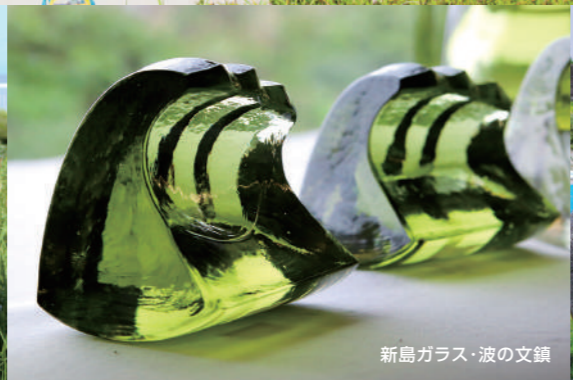
新島ガラス・波の文鏡