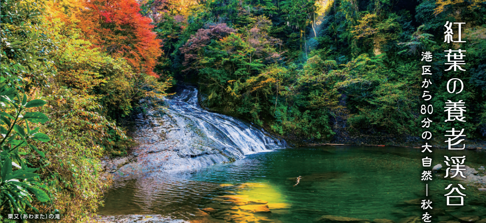
粟又(あわまた)の滝