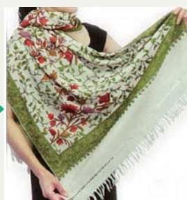
②片側を細くまとめ巻き 付け、逆側のストールの 端をつまむ