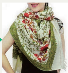
④通した端を後ろに自然 に流し、ドレープを整えて できあがり