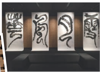
和菓子や日本文化を発信する展示やイベントを行っています