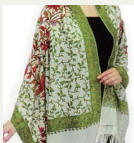
①両肩にストールをかけ る。

刺繍ストールの美しさを表現できるアレンジ巻。ドレープとは垂らした布の流れるようなひだのことです。