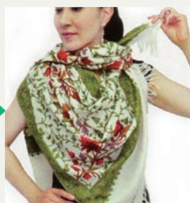
③つまんだ部分を首に巻 き付けた側の下から通し ます