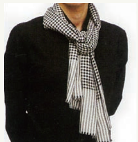
⑤形を整えてできあがり