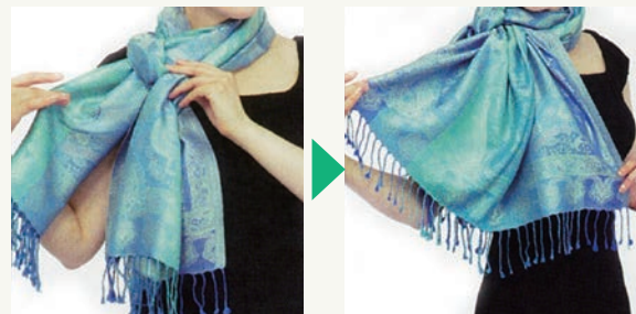
①クロス巻きの結んだ部分を片側の肩の方に回して移動する

クロス巻きに少し手を加えるだけで、また違った印象になります。ふわっと、形を整えて、ストールを左右にずらしたり、両肩にかけたり、それだけでとてもオシャレになります。