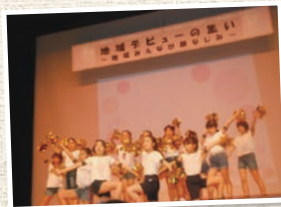
地域の子どもたちによる元気 いっぱいのパフォーマンス