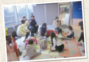
親子で楽しめる子ども広場も あります

●問い合わせ：赤坂地区総合支所 協働推進課 協働推進係 電話 03-5413-7272