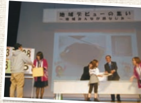
豪華景品が当たるチャンス のお楽しみビンゴ大会!