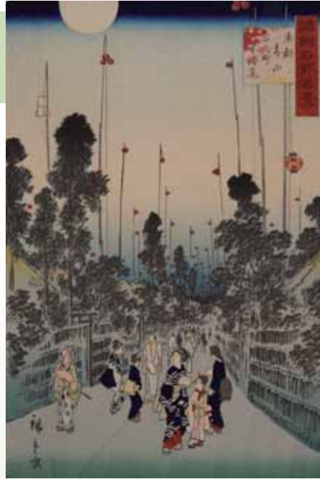
諸国名所百景 東都青山百人町 星燈籠 広重 (歌川広重二代)

The origins of old town names in Aoyama Area