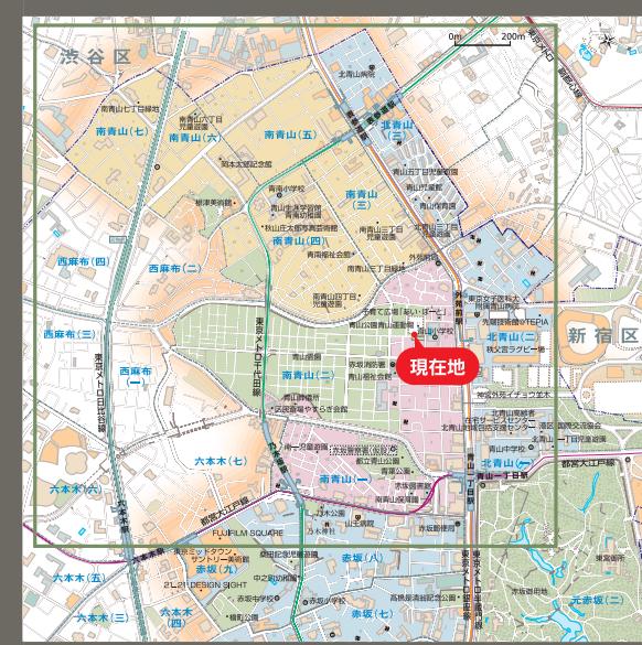
現代の地図 (平成31年)