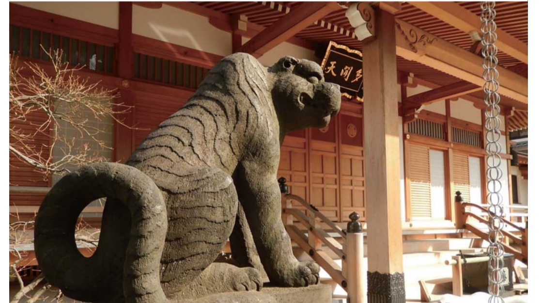
平成28年(2016年):本堂前の虎の像