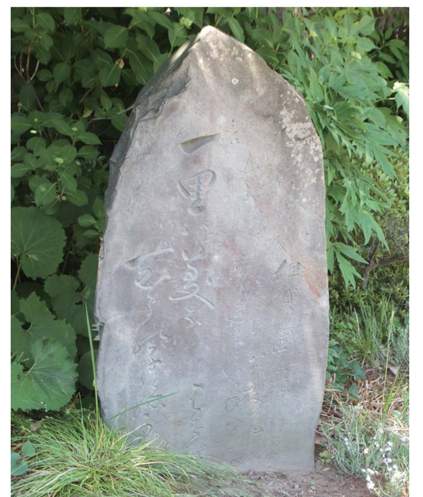
平成27年(2015年):芭蕉の句碑

天現寺は享保4年(1719年)に建立された寺院で、本尊として毘沙門天の像をまつている。毘沙門天は多門山ともいわれる四天王のひとりで、七福神のひとりにも数えられている。憤怒の表情、左手に宝塔を捧げ、右手に矛を持ち、甲冑で身を固めた姿で知られている。天現寺の本尊はケヤキの木造で、高さは約1メートル、平安後期の作と推定されている。