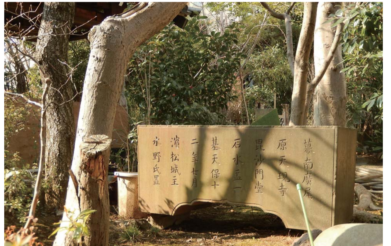
平成28年(2016年):庭園内の手水鉢

刻まれている文字から、浜松城主で、天保の改革を行った水野越前守忠邦から贈られたものと推察される。