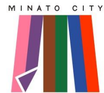
▲港区シティプロモーション シンボルマーク

認定された事業は、区が所有するプロモーショングッズの貸出し、港区シティプロモーションシンボルマークのデータ提供のほか、区の情報発信媒体（ホームページやSNSなど）による周知を行うとともに、認定区分に応じて事業に係る経費の一部を助成するなど、積極的に事業の支援を行うことで、行政だけでなく、個人・団体等が相互に連携、協働を図り、港区の力を結集したシティプロモーションを推進します。