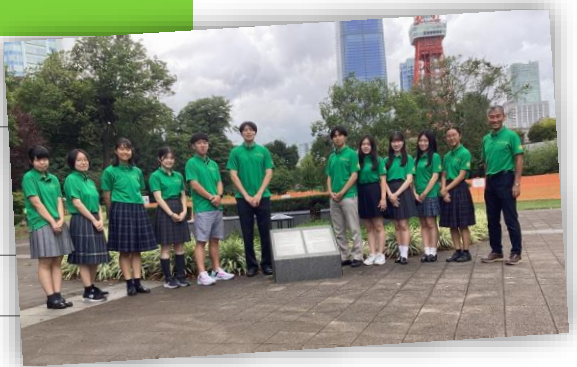
平和の灯の前にて