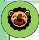
らいおん組(5歳児クラス)

はさみを使って色画用紙を細長く切ります。『連続切り』に挑戦です。切った紙をこいのぼりの台詞ののりで貼ります。のりを指に取りながら「これくらいかな?」と自分たちで考えて調整する姿も見られました。