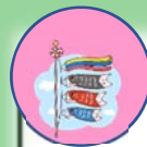
5月保育園であそぼう

5歳児クラスは、友達と協力してグループごとの製作です。素材から友達と話しあって考えました。大好きなカメをイメージして甲羅をつけてみたり、自由な発想でアイデア豊かなこいのぼりが出来ました。