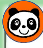
ぱんだ組(4歳クラス)

和紙を三角形に折って、角を絵の具につけて染めてみました。子ども達が好きな色を3色選び、乾かしてから開いてみると「わあ、きれい!」と大喜びでした。みんな違う模様のきれいなこいのぼりができました。