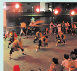
老いも若きも輪になって踊る