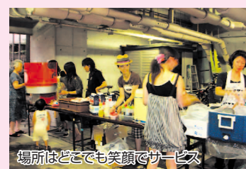
場所はどこでも笑顔でサービス

今年から群馬県から切り出してきた立派な清々しい青竹、中庭の緑の前に狭い廊下での流しそうめんは何回にも分けて振る舞われました。自転車置き場での模擬店、エレベーター前にシートを敷いて飲んだり食べたり、今年も引越した住民も訪れ、和やかで独特な雰囲気のお祭りでした。