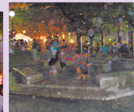
洋服びしょぬれで元気に動きまわる子どもたち