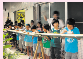
青竹だから清々しい