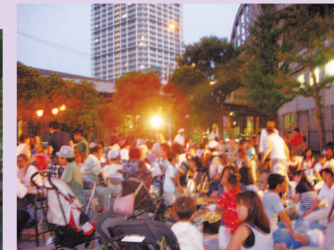
ひろーい運動場もからだがふれ合うにぎやかさ