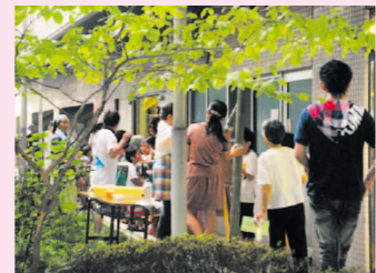
狭い廊下もかえって落ち着く