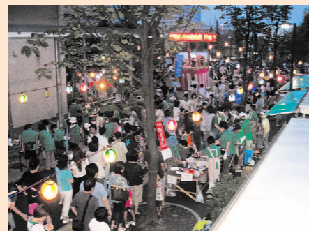
食べ物屋台になが〜い行列!