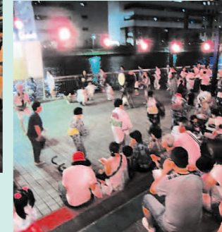
運河沿いの遊歩道は祭りの人出で大にぎわい 踊る人と観る人が一体となって盛り上がる