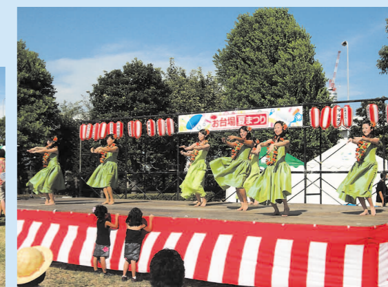
真剣にステージを見つめる子どもたち