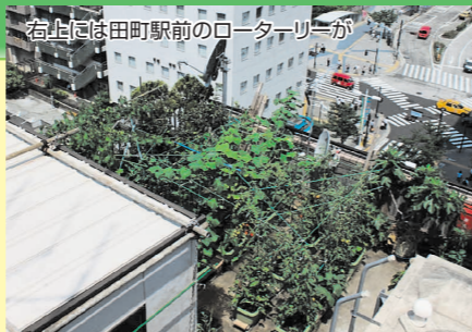
右上には田町駅前のロータリーが

屋上菜園とまではいかないまでも、環境にも身体にもやさしい無農薬プラントー菜園、ミニトマトなどの育てやすいものからチャレンジしてみたいはいかがでしょうか?