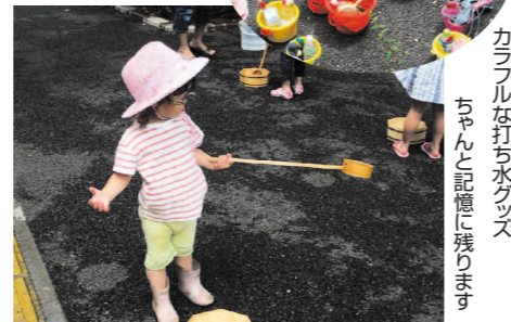
カラフルな打ち水グッズ ちゃんと記憶に残ります