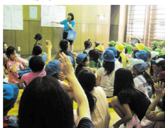
クイズ形式のガイダンス