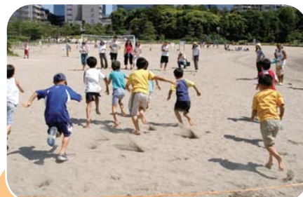
旗へ向かって一直線!「ビーチフラッグス」

6月とは思えない真夏のような日差しの中、参加した皆さんはビーチスポーツを思う存分楽しみ、大人も子どもも一緒に、笑顔いっぱいの日となりました。