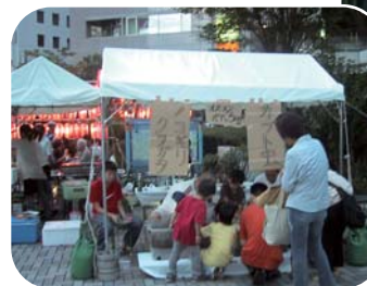
子どもたちの人気はやはりカブトムシ

今年の夏は記録的な猛暑を日本各地で観測し、日本全国暑い夏となりました。ベイエリアでは、暑さを吹き飛ばすような活気のある夏祭りが各地で開催されました。