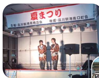
祭りの雰囲気を感じ上げる漫才