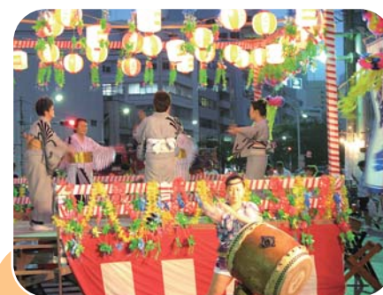
威勢の良い太鼓に合わせた恒例の盆踊り

今年の芝浦2丁目盆踊り大会は、台風のため33回の歴史の中で初めて1週間延期となり、7月21日だけの1日開催となりました。そのため子どもたちをはじめ、待ちわびた人々が集まって大にぎわいになりました。お菓子、ゲーム、食べ物などに長い列ができ、新しく整備された船路橋と遊び場にもたくさんの方が集まりました。毎年恒例の盆踊りも、威勢の良い太鼓に合わせてみんなで盛り上がりました。