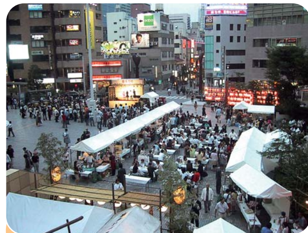
夜が更けるにつれて祭りは大にぎわい

梅雨もようやく明けた7月20・21日、品川駅港南口広場で夏祭りが開催されました。場所柄、家族連れに混じって勤め帰りのサラリーマンが帰途の電車に乗る前のひとときを楽しむ姿も見られました。