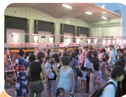
ポップコーン、わたあめ、焼きそばなどに長い列ができました