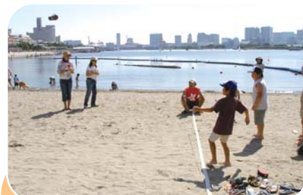
目指せ!世界記録「ピーサンとばし」