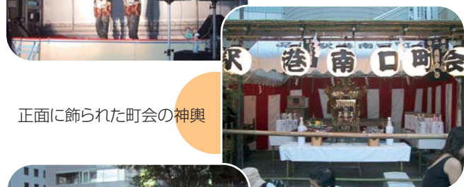
正面に飾られた町会の神輿