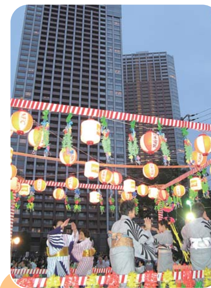
船路橋が開通して芝浦アイランドとつながり、大勢の人が集まりました