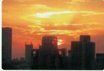
こしあん大好きさんの作品「彼方の富士」