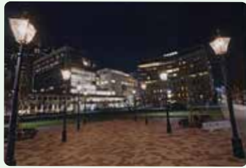
泥谷 隆史さんの作品「夜の芝浦公園前景」