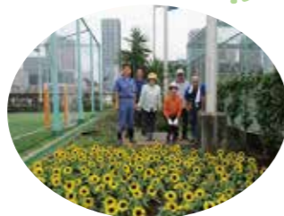
みどりのあるまちづくり分科会一同

平成27年4月にみどりのあるまちづくり分科会が発足して以来、この地域で、どのような活動を行うのが分科会の目的に合致するのか？日々試行錯誤しています。平成28年度は、活動の一環で、「グリーンツアー in 芝浦アイランド」や、芝浦中央公園での花畑づくりを実施しました。興味のある方、私たちとともに活動をしませんか。