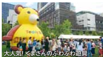
大人気! くまさんのふわふわ遊具

地区には子ども達が楽しめるイベントがたくさんあります。イベントカレンダーもよく見てみてくださいね。