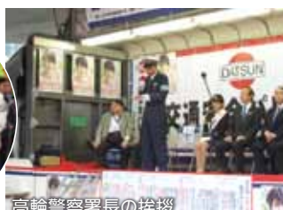
高輪警察署長の挨拶