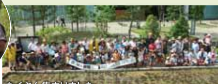
たくさん集まりました