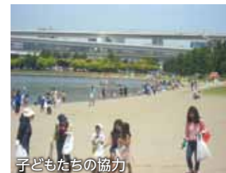
子どもたちの協力

との事です。この事業も既に22年目に入り、毎年3回実施され、参加者の輪も年々広がって来ています。今年は地元のお台場学園からも小学生が100名も参加してくれたそうです。