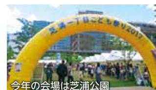
今年の会場は芝浦公園

6月4日(日)、芝浦公園で「芝浦一丁目こども祭2017」が開催されました。このお祭りは、山車と子ども神輿で芝浦一丁目町内を巡り、氏神様への感謝の気持ちとともに子ども達の健やかな成長を願って開催されているお祭りです。お神輿は小学生以上のお兄さんお姉さんが担ぎ、小さな子ども達は後ろに