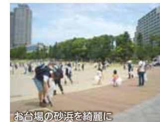
お台場の砂浜を綺麗に