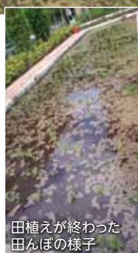
田植えが終わった田んぼの様子