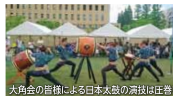
大角会の皆様による日本太鼓の演技は圧巻!