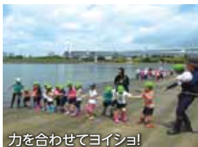
力を合わせてヨイショ!