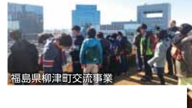
福島県柳津町交流事業