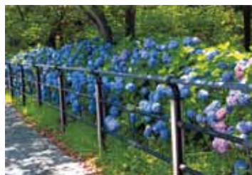
小坂 善男さんの作品 「アジサイ咲くお台場海浜公園」