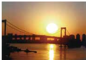
青木 千恵子さんの作品 「レインボーブリッジと朝日」

夏色のそよ風 雨上がりの日曜の朝 眠い目を擦りながら お台場行きのバスにあわてて飛び乗り 出勤する時間に追われ余裕のない私です 渋滞になりレインボーブリッジの上で 久々にあなたを見つけました そう… あれは冷たい風の夜でした 泣きそうな顔で本気で変わりたいと言ったあなたに 笑むことしかできず夕彩橋を後にした私… あなたはいつだって私と逢うと温かい気持ちに なれると言ってくれました ごめんね…矢の様に過ぎ去る毎日の中で あれからずっとあなたのことを忘れていました 快晴の今、黒い服しか着なかったあなたが 色彩やかな夏色のシャツで白い仔犬とじゃれ合って 満面の笑み…とてもいきいきしています 青空に透け込んであなた自身がそよ風そのものです 私の心が夏色のそよ風でいっぱいになりました