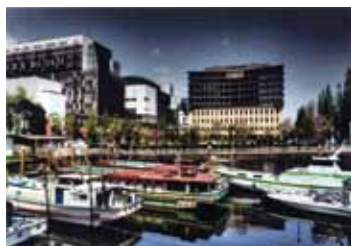
泥谷 隆史さんの作品 「船溜りの初夏」