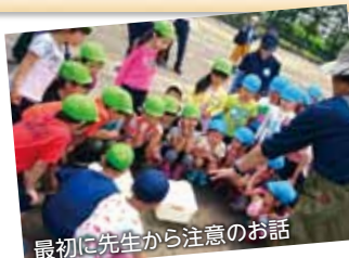
最初に先生から注意のお話