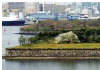
台場 にじ子さんの作品 「台場公園の大島様」