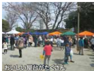
おいしい屋台がたくさん

今年も「港南ふれあい桜祭り」が開催されました。今年全国的に桜の開花が遅く、運河沿いの緑地に咲く桜は2分咲きとやや物足りなかつたですが、数年ぶりの快晴により、多くの来場者が訪れ、お祭りに活気をもたらしていました。毎年恒例のステージイベントや運河めぐりはすっかり板につき、今年から始まった港南地域対抗ボートレース大会も大盛況の中終わりました。