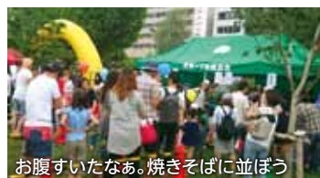
お腹すいたなあ。焼きそばに並ぼう