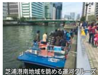
芝浦港南地域を眺める運河クルーズ