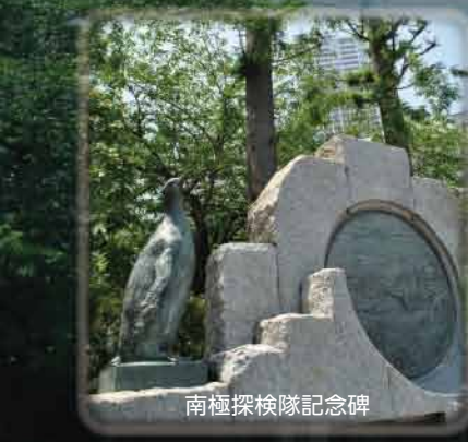
南極探検隊記念碑