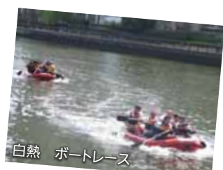
白熱 ボートレース