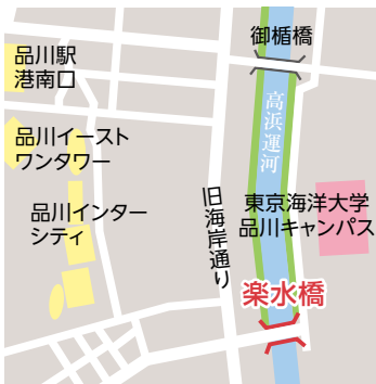
●幅：4.5m ●長さ：76.6m ●昭和44年3月架替え