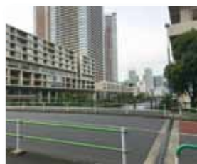
●幅：18.7m ●長さ：54.1m ●昭和35年9月竣工

芝浦アイランド南地区(民間事業者6社が旧三井製糖跡地から平成14年に取得した後に、両地区一体の再開発事業が開始された)と海岸通りをつなぐ橋です。東京港の発展の意味を込めて命名されました。このエリアに完成した芝浦アイランドは、地区全体では総戸数約4,000戸、人口約10,000人の街となっています。海岸通りから渡って左側にはケーブタワーがあり、超高層住居用の建築物としては日本で二番目のトライスターフォルム。右側にはブルームタワーと介護付き老人ホームとサービス付き高齢者住宅、クリニックモール「ドクターズポート」(内科・リウマチ科・小児科)、皮膚科、薬局があり幅広い世帯の方々が暮らす街を形成しています。