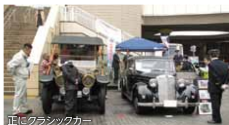
正にクラシックカー