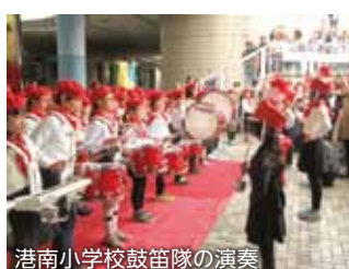
港南小学校鼓笛隊の演奏