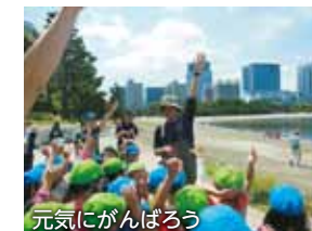
元気ががんばろう

講師の方によれば、お台場の砂浜や浅瀬には、20種類を超える生物が生息しているそうです。「東京港を泳げる海に」をモットーに、20年以上も継続されている「東京ベイ・クリーンアップ大作戦」などの環境保護活動が、着実に実を結んでいるのです。