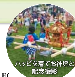
ハッピーを着てお神輿と記念撮影

ついて町内を元気に巡った後はお菓子やジュースをもらって、みんなほくほくの笑顔でした。芝浦一丁目町会、芝浦一丁目商店会の皆様から、子ども達、参加された方々に焼きそばやかき氷が提供され、美味しそうにはおぼる姿がたくさん見えました。くまさんのふわふわ遊具には子どもの行列がずら〜っと、行儀よく待つ姿が微笑ましかったです。夏祭りも楽しみだよね、なんて話す姿もちらほら。芝浦港南