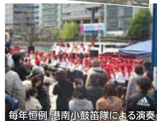
毎年恒例 港南小鼓笛隊による演奏