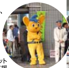
警視庁のマスコットキャラクターも応援