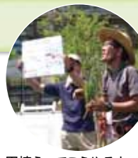
田植えってこうやるよ

参加された方からは「貴重な体験ができました!」や、早くも「稲刈りが楽しみ!」といった声が聞こえてきました。みなとパーク芝浦に寄られた際は、ちょっと寄り道して、隣の公園にある「田んぼ」の成長も見ていただけたらと思います。