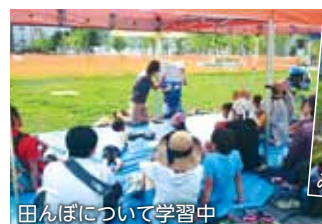
田んぼについて学習中