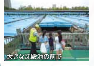
大きな沈殿池の前で