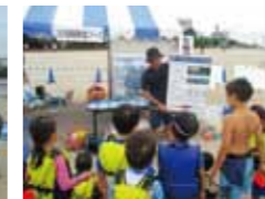
クラムマットの説明