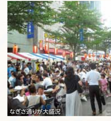
なぎさ通りが大盛況