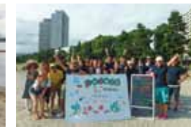
お台場海水浴を満喫しました!