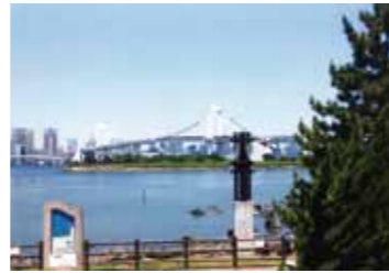
小坂 善男さんの作品 「お台場の風景」