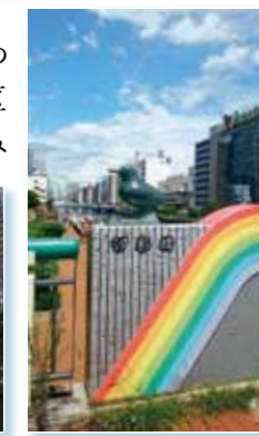
●幅: 18.0m ●長さ: 45.7m ●平成12年3月竣工