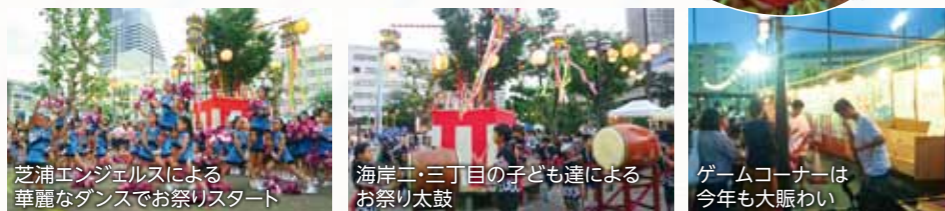
芝浦エンジェルスによる華麗なダンスでお祭りスタート 海岸二・三丁目の子供達によるお祭り太鼓 ゲームコーナーは今年も大賑わい