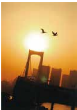
台場 にじ子さんの作品 「素晴らしいタイミング!」