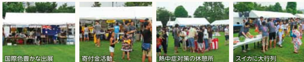
国際色豊かな出展 寄付金活動 熱中症対策の休憩所 スイカに大行列