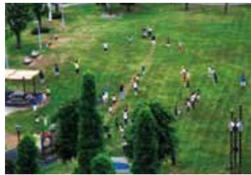
台場 にじ子さんの作品 「レインボー公園の夏の朝」