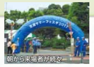
朝から来場者が続々

小学生に混じって施設見学に参加しました。1組ずつガイドつきで案内していただけます。ここに集められた下水は、50種類以上の微生物が汚れを分解し、なんと半日から1日できれいな処理水となって東京湾へ放流されるそうです。キモカワな微生物を顕微鏡で観察することもできますよ。ほかにも起震車体験やスーパーボールすくいなど、たくさんのコーナーが用意されていて、小さな子供から大人まで1日中楽しめて勉強にもなるサマーフェスタです。来年は皆様もぜひ遊びに行ってみてください。