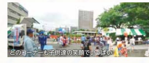
どのコーナーも子供達の笑顔でいっぱい