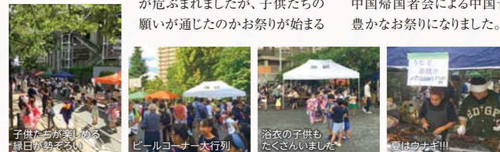
子供たちが楽しめる縁日が勢ぞろい ビールコーナー大行列 浴衣の子供もたくさんいました 夏はウナギ!!!

午後には陽も出て、爽やかなお祭り日和になりました。このお祭りは“子供も大人もみんなが楽しめる”をテーマに催され、子供達のチアリーダーや会場内での子供神輿、中国帰国者会による中国音楽と舞踊も華を添え国際色豊かなお祭りになりました。公園の内外には屋台が多数