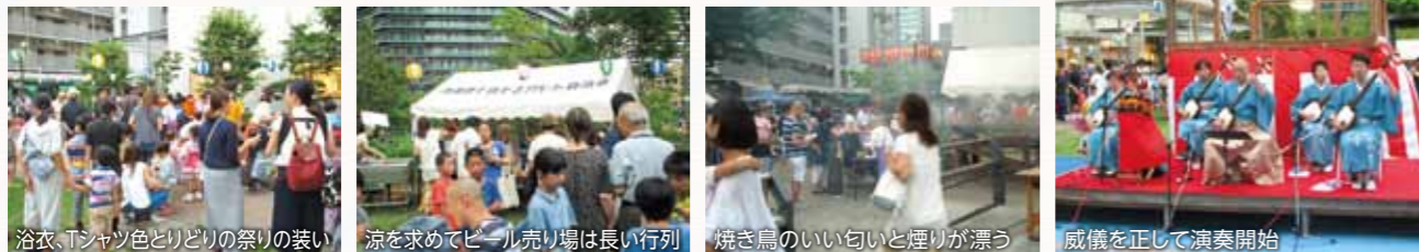
浴衣、Tシャツ色とりどりの祭りの装い 涼を求めてビール売り場は長い行列 焼き鳥のいい匂いと煙りが漂う 威儀を正して演奏開始

三味線演奏のグループがお揃いの着物で勢ぞろい。生憎、演奏が始まると大粒の雨が降り始めましたが、息の合った熱演に聞き入る聴衆は大きな喝采を送っていました。