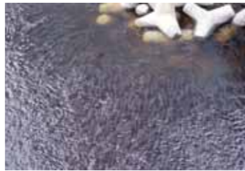
泥谷 隆史さんの作品 「ある日の「新港南橋」下寸景」