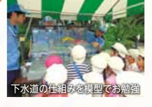
下水道の仕組みを模型でお勉強