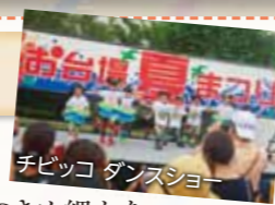
チビッコダンスショー

日光を遮る休憩所もあり、主催者のきめ細かな配慮を感じ取られました。イベントでは子供達のダンスや空手の演舞、フラダンスなど日頃の練習の成果を披露する場面も多くあり楽しませて頂きました。さらに寄付金を募るテントもあり地域の人々の意識の高さを感じさせられました。