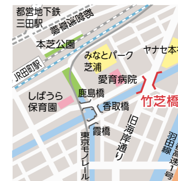
●幅: 27.7m ●長さ: 40.0m ●昭和46年9月竣工

パーク芝浦や愛育病院ができたことから、幅広い世代の方が往来している竹芝橋。運河沿い緑地やメタセコイヤも見えて非常に眺望も豊かな場所です。橋台敷には珍しい桜が咲いています。「御衣黄桜」という桜です。この桜は、色が白色から淡緑色であり、近くに咲く桃色の桜とのコントラストがとても美しいです。何気ない通行で行ったことはあるかもしれませんが、ぜひ一度、歴史やその地域の変遷を思い浮かべながら歩いていただければと思います。