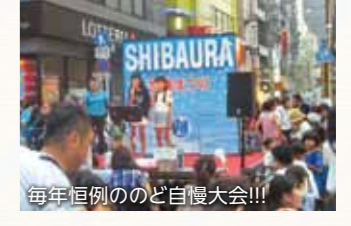
毎年恒例ののど自慢大会!!!