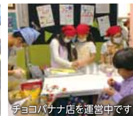
チョコバナナ店を運営中です