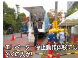
エレベーター停止動作体験には多くの人が!