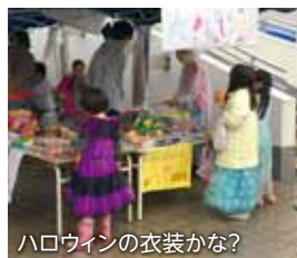
ハロウィンの衣装かな?