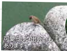
可愛らしい出会いもあります