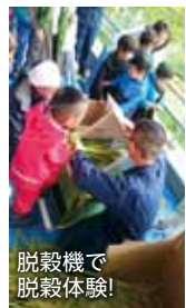
脱穀機で脱穀体験!

10月に入って連日の雨。雨天決行とはいえ朝から冷たい雨で参加者は来るだろうか?と心配をしていましたが、子ども達の賑やかな声が聞こえてきてほっとしました。たくさんの方が「稲刈り体験」に参加されました! 普段できない体験に、雨なんて吹き飛ばす歓声を上げながら、一つひとつの作業を楽しんでいました。大人はカマで、子どもはハサミで刈り取ります。あっという間に刈り終わり、はぎ掛け(刈り取った稲を束にして、乾燥のため吊り干しする工程)や、レトロながらも今も農家さんで実際に利用されている足こぎ脱穀機で、脱穀体験! 田植えにも参加した、や、芝浦公園に来る度に成長を観察していたよ、という親子の姿もたくさん見られました。普段食べているお米がどうやって育ち、食卓に並ぶまでにいろいろな人の手がかかっていることを学べる貴重な体験でした。芝浦産のお米の味はどんな味かしら?