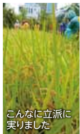
こんなに立派に実りました