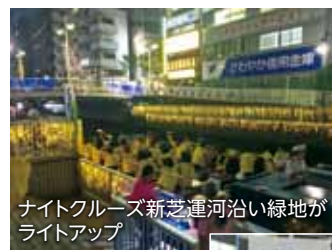
ナイトクルーズ新芝運河沿い緑地がライトアップ

10月1日(日)・2日(月)、なぎさ通り及び新芝運河沿い緑地において「芝浦運河まつり」が開催されました。今年度は10月開催となり、秋晴れのさわやかな青空のもと多くの方が来場されました。なぎさ通りを通行止めにし、配置された椅子には人がぎっしり。両サイドに配置された屋台も大繁盛。また新芝運河沿い緑地では、毎年恒例の運河クルーズに長蛇の列ができ、これまた毎年恒例の町内対抗ボートレース大会も大盛り上がり。翌2日に行われたナイトクルーズにも、多くの来場者が訪れ、在住から在勤まで様々な方が芝浦の運河の魅力を感じました。