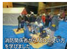
消防関係者からAEDの使い方を学びました