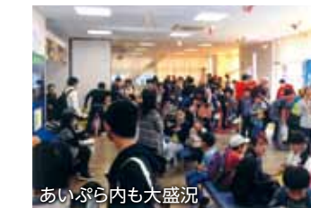
あいぷら内也大盛況