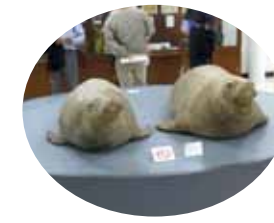
可愛らしいゴマフアザラシの標本

普段は海洋科学の中心として第一線の調査研究に精進している学園が、海にまつわる食、遊、学を集めた皆が楽しめるテーマパークになっていました。