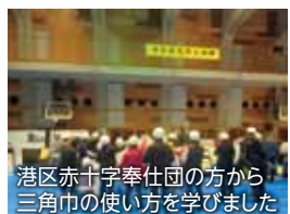
港区赤十字奉仕団の方から三角巾の使い方を学びました

芝浦・海岸地域の住民の方や関係者を含め、1,728人のみなさまにご参加いただきました。