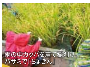
雨の中カッパを着て稲刈り、ハサミで「ちよさん」