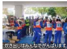
炊き出しはみんなでがんばります

を疑似体験できる専用車を用意しました。また、情報処理・掲出訓練では、各自治会が集めてきた火災や建物被害などの想定情報を集約し、一つのマップを作り上げました。さらに、D級ポンプ放水訓練では、雨天のため使用できなかったグラウンドに向けて豪快に放水を行うなど、来場者のみなさまは例年の晴天時とは異なった訓練を楽しんでいたようです。