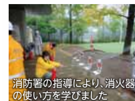
消防署の指導により、消火器の使い方を学びました

当日は、芝浦小学校の児童も登校し、消防関係者や地元ボランティアティーチャーにご指導いただくなど、楽しみながら有意義な防災知識を身につけることができました。また6年生児童向けには、いのちを守るatプロジェクトJAPANによる防災ワークショップを開催いたしました。