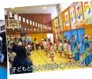
子どもと大人で仲良くフラダンス