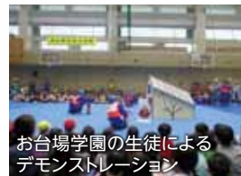
お台場学園の生徒によるデモンストレーション