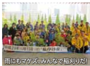
雨にもマケズ、みんなで稲刈りだ!