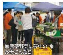
無農薬野菜に夢中のお母さんたち