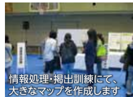
情報処理・掲出訓練にて、大きなマップを作成します