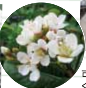
可憐な花が迎え入れてくれました