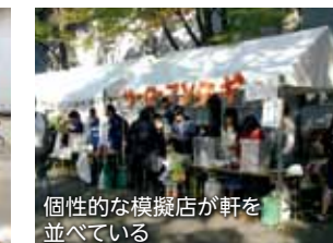
個性的な模擬店が軒を並べている