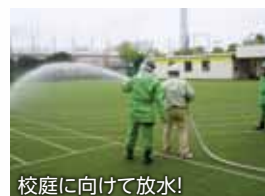
校庭に向けて放水!