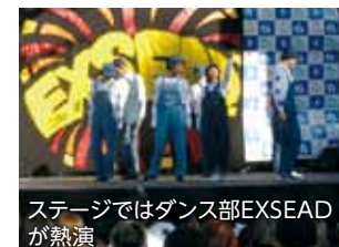
ステージではダンス部EXSEADが熱演