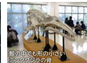
鯨の中でも形の小さいミンククジラの骨