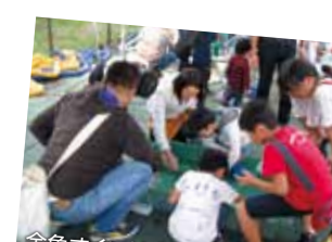
金魚すくいは大人が熱中