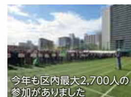
今年も区内最大2,700人の参加がありました

このように子供から大人まで様々な人が参加している港南会場に、ぜひ来年はご参加ください。