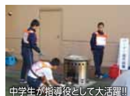
中学生が指導役として大活躍!!