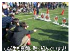
小学生も真剣に取り組んでいます!