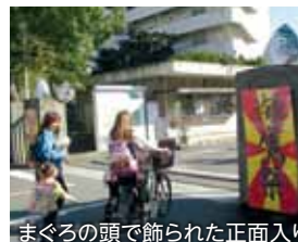
まぐろの頭で飾られた正面入り口