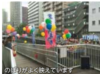
のぼりがよく映えています