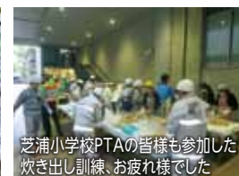
芝浦小学校PTAの皆様も参加した炊き出し訓練、お疲れ様でした