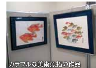
カラフルな美術魚拓の作品