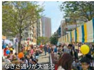
なぎさ通りが大盛況