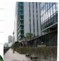
どことなく異国情緒がします