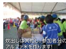
炊出しは天忙し。参加者分のアルファ米を作ります!