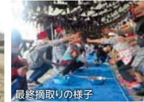
最終摘取りの様子