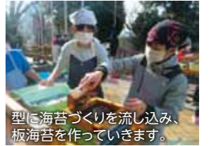
型に海苔づくりを流し込み、板海苔を作っていきます。