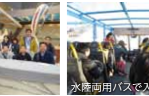
水陸両用バスで入水!