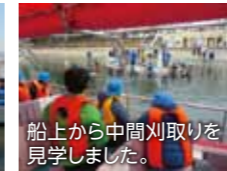
船上から中間刈取りを見学しました。