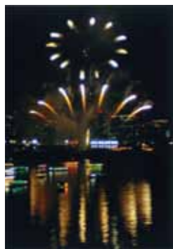
台場 にじ子さんの作品 「レインボー花火」

芝浦港南地区の人、暮らしを伝える作品をお送りください。応募方法は、作品にタイトルを添えて、住所・氏名・電話番号・作品の返却希望の有無・匿名またはペンネーム使用希望の有無を明記の上、べいあっぷ編集部までお送りください。写真はデータでもプリントでもOKです。携帯写真でも大歓迎です。読者のあなたが「べいあっぷ」を盛り上げてください。