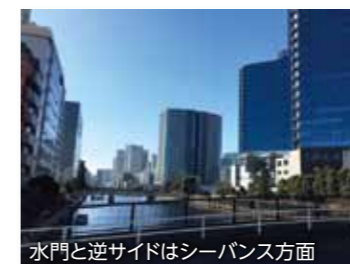
水門と逆サイドはシーバンス方面