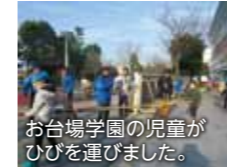
お台場学園の児童がひびを運びました。

の最終摘取りのときには、立派に成長していました。収穫した海苔は、お台場学園の5年生が板海苔や佃煮に加工しました。また5年生は、取れたての生海苔を用いたみそ汁に舌鼓を打ちました。お台場学園の5年生は、初めて見て触る海苔に感動するとともに、お台場の海の豊かさを肌で感じました。