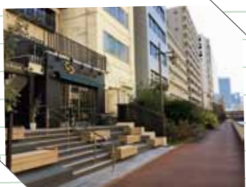
道路側からの通路入口

「新芝運河沿緑地」が続いているのをご存知ですか。周囲をビルに囲まれ、ちょっと地味だったこの芝浦4丁目界限に、昨年12月、おしゃれな水辺スポットが誕生しました。他の建物とは趣を異にする外観が印象的な複合施設「THE HARBOUR 芝浦」の隣に、運河沿緑地と隣接する階段状のベンチが設置され、どなたでも無料で使用することができます。先日、本稿取材のために改めて訪れたところ、真冬なのに数種類の花が咲き乱れていて驚きました。休日の早朝、私の他には野良猫だけ。のんびりと散歩ができる穴場です。(塩沢 美樹)