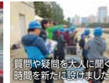
質問や疑問を大人に聞く時間を新たに設けました。