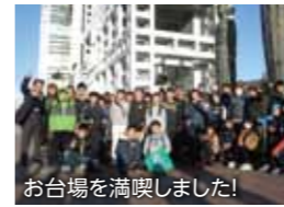
お台場を満喫しました!

子どもたちの笑顔がとても印象的であり、充実したお台場での2日間を過ごしていました。