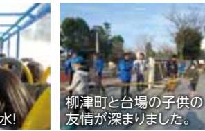
柳津町と台場の子供の友情が深まりました。