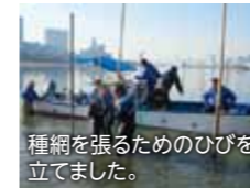
種網を張るためのひびを立てました。