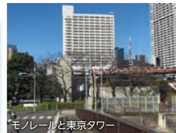
モノレールと東京タワー