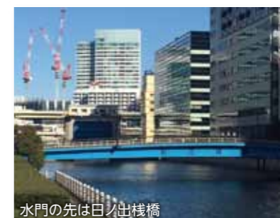
水門の先は日ノ出棧橋

芝浦運河に架けられた橋で芝浦一丁目と海岸二丁目を結ぶ。長さ56.1m 幅12.8m 昭和56年竣工。最寄り駅はJR浜松町駅か大江戸線、都営浅草線の大門駅、この橋を渡って日ノ出棧橋に向かうことも可能。運河の両サイドはボードウォークが整備され、訪れる人の憩いの場となっている。日ノ出棧橋からはTokyo Cruiseが発着しており台場、豊洲、浅草などの地域を結んでいる。更に東京湾クルーズも開催され海辺の美しさを人々に提供している。これは個人的なお勧めスポット情報だが、晴れた日には橋の上からカラフルな化粧をした東京モノレールの車体やその後ろには東京タワーも見え、なかなかの名所だと思っている。