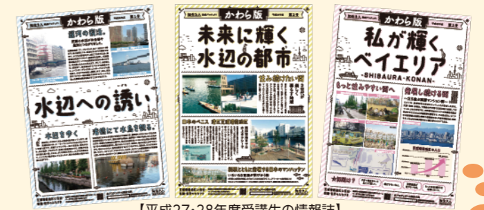
【平成27・28年度受講生の情報誌】

特別講座では、これまで学んできた地域の魅力を振り返り、多くの人にその魅力を伝えるための「かわら版」(壁新聞)を作成しました。 受講生の皆さんからは、「意外と知られていない地域の歴史を伝えたい」「日々発展を続ける、活気あふれるまちである」「運河にもっと目を向けてほしい」など、様々な地域の魅力が挙がっていました。