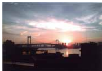
松岡 栄子さんの作品 「レインボーブリッジ水面の朝日」