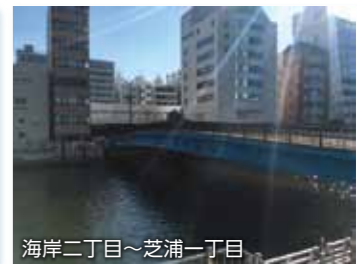
海岸二丁目～芝浦一丁目