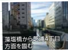
藻塩橋から芝浦4丁目方面を臨む

「新芝運河」は、田町駅東口を降りて芝浦アイランド方面に直進すると、すぐに見えてくる水路です。運河沿いを左へ行けば、このコーナーでも紹介された「リバーサイドトリオ」の銅像や雰囲気のあるガス灯で知られる芝浦1丁目界限ですが、右へ進み、藻塩橋を超えた先にも