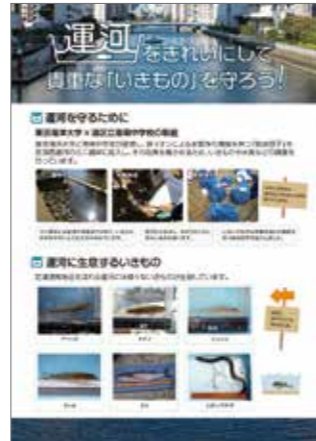
運河の環境啓発資料