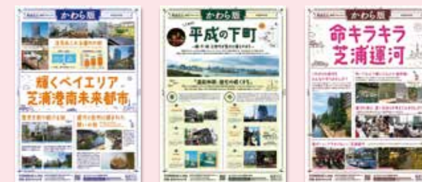
平成29年度受講生が作成した「かわら版」