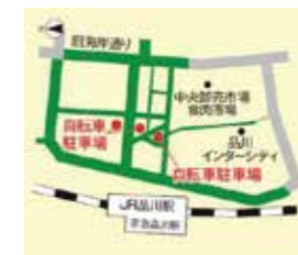
品川駅港南口周辺

芝浦港南地区総合支所では、放置自転車を無くし、安全で快適な歩行環境を目指しています。皆様のご理解、ご協力をお願いいたします。