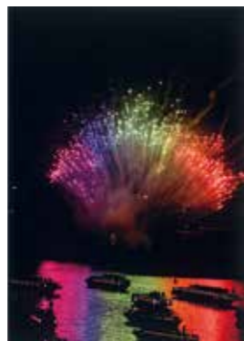
台場 にじ子さんの作品 「お台場海浜 12月の花火」