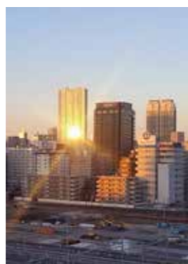
國分 秀徳さんの作品 「港区の初日の出」