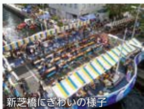
新芝橋にぎわいの様子