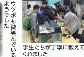
学生たちが丁寧に教えてくれました