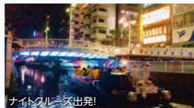
ナイトクルーズ出発!