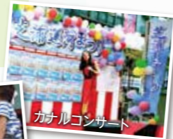
カナルコンサート