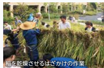
稲を乾燥させるはざかけの作業