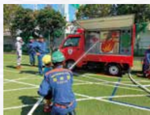
まちかど防災訓練車を使つての放水体験

される「お台場学園防災Jr.チーム」が各訓練をサポートし、デモンストレーションを行うなど活躍しました。お台場学園港陽小学校の児童も授業の一環として各訓練を体験し、中学生や消防士さんの指導のもと、楽しみながら防災について学ぶことが出来ました。お台場地区防災協議会をはじめ、子どもから大人まで地域住民の皆様が高い防災意識を持って参加されました。