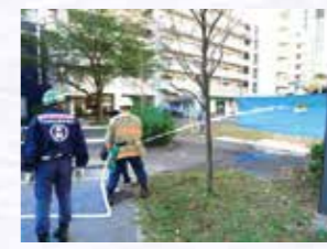
屋内消火栓取扱訓練

今年度も、港南中学校の生徒が、情報処理・掲出訓練、バーナー取扱訓練などの各訓練の指導役として活躍し、港南小学校の全校児童も初期消火訓練、応急救護訓練などの各訓練に参加し、地域一体での訓練が行われました。