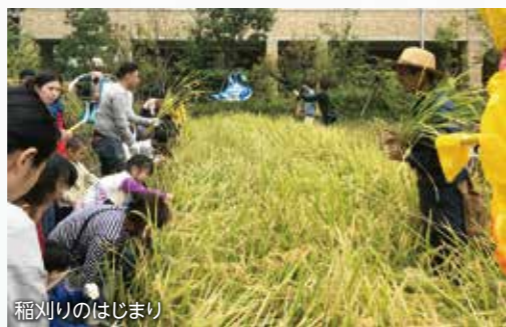
稲刈りのはじまり