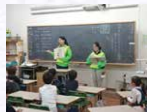
芝浦小地区防災協議会による防災紙芝居