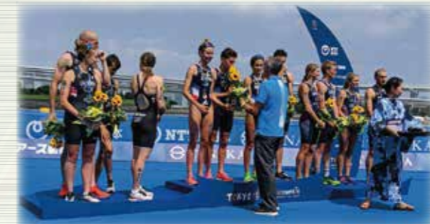
混合リレー表彰式

港区が世界に誇るレインボーブリッジや大観覧車に囲まれた都会的なロケーションのコースは、選手だけでなく、観客も楽しめる魅力的な会場となっています。来年の本番が今から待ち遠しいです。