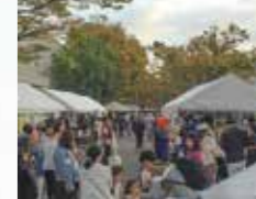
幅広い層が楽しめました