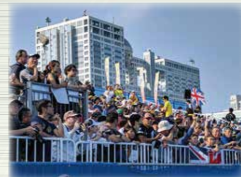
早朝から観客の熱い応援