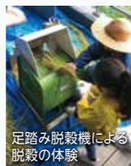
足踏み脱穀機による脱穀の体験