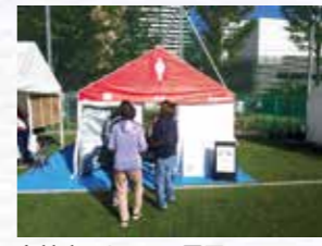
女性専用トイレの展示