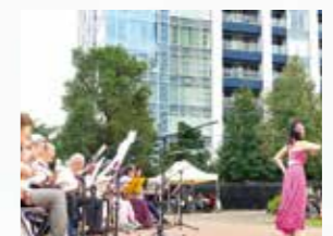
ウクレレにフラダンスで、ハワイ気分を満喫