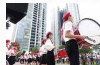
オープニングは、港南小学校の鼓笛隊が華麗にビートルズナンバーを演奏