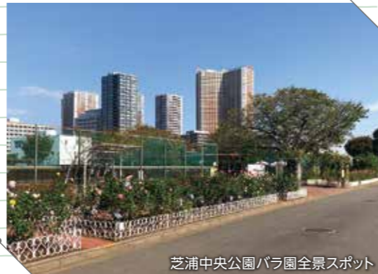
芝浦中央公園バラ園全景スポット

港区のホームページを見ると、区の花はバラなのだそう。バラの身近な鑑賞スポットとしては、芝浦中央公園バラ園がある。アンゲリカ、真夜、アメリカンライトなど、40種ほどのバラが植えられており、5月中旬と10月下旬が見頃で、この期間ローズガーデンフェスタが開催され、多くの種類のバラの競演が楽しめる。芝浦中央公園は、品川駅と田町駅の間に位置し、品川駅港南口徒歩10分程の品川シーズンテラスの中を通り抜けると直接公園に通じている。