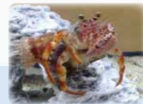
ヤドカリ(借り)が観客に時間をかき貸してくれました(笑)

連日ステージで大学生の音楽・ダンスパフォーマンス等もあり、スペシャルゲスト(各地を回遊する水産系芸人のハトリ・WAY WAVE・海洋大学名誉教授のさかなクン・sora tob sakana等)も観客を楽しませ続けました。来年の第61回もお薦めです!