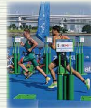
バイクを終え、残すは2キロのラン! 女子選手から男子選手へタッチ(日本)