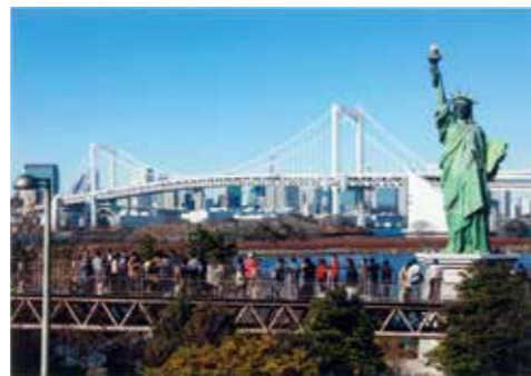
「小坂善男さんの作品 「お台場、観光客でいっぱい」」