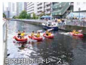
町内対抗ボートレース