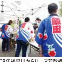
"8年後品川からリニア新幹線40分ほど"の長野県飯田市からはリンゴならぬ焼きそばの応援