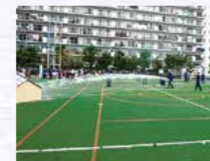
芝消防団第8分団によるポンプ操法演習