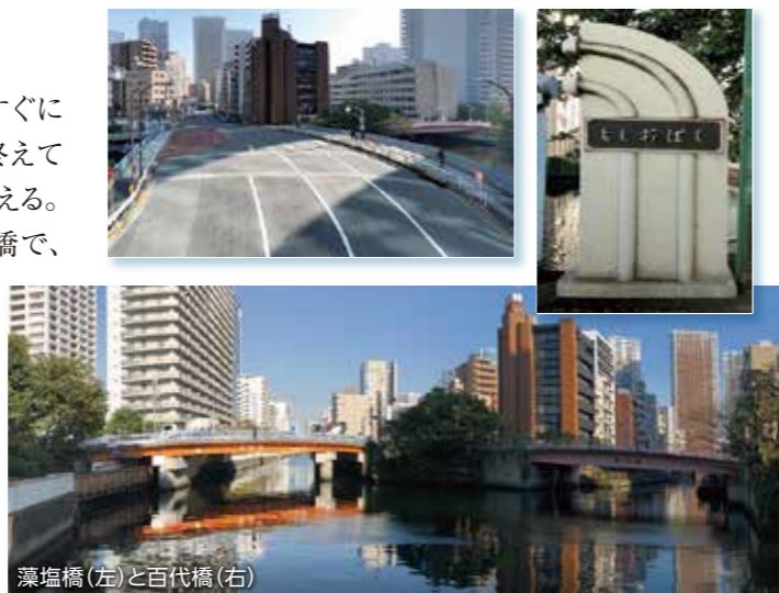
藻塩橋(左)と百代橋(右)