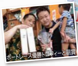
ボートレース優勝トロフィーと副賞