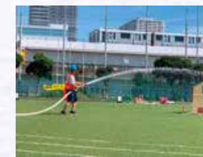
お台場学園防災Jr.チームによるデモンストレーション