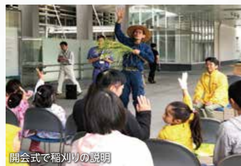
開会式で稲刈りの説明