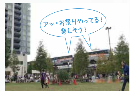
アッ・お祭りやってる! 楽しげ!