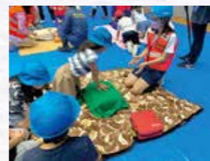
中学生が様々な訓練をサポートしました