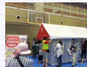
仮設トイレの設置を来場者に体験してもらいました