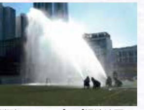
消防団によるポンプ操法演習