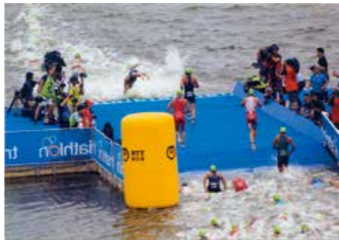
「台場にじ子さんの作品 「2020テスト・トライアスロン」」