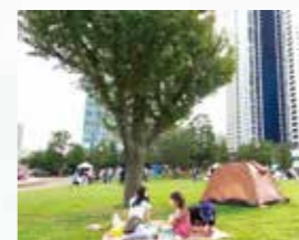
秋のやわらかい日差しの中、それぞれのスタイルでお祭りを満喫