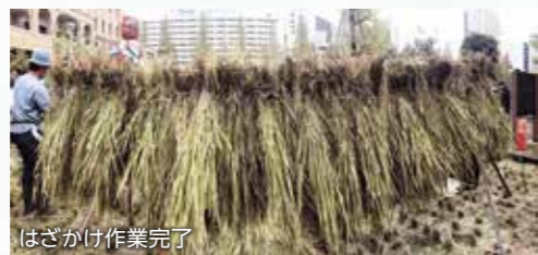
はざかけ作業完了