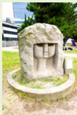
お台場海浜公園「モヤイ像」