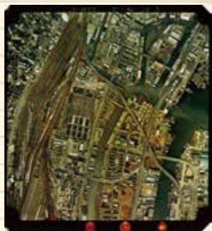
1972年の高輪ゲートウェイ駅周辺の空中写真。田町車両センターが見えます

Aerial photo of the Takanawa Gateway Station area in 1972. The Tamachi Train Center can be seen.