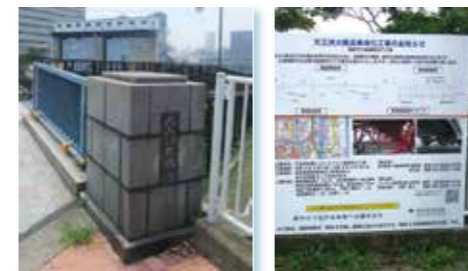
(上り・下り) ●長さ: 111m ●幅: 15m ●竣工: 昭和38年5月

天王洲運河に架かる橋としては「天王洲ふれあい橋」がスポットとして人気がありますが、その東西の幹線道路に架かっているのが天王洲橋、天王洲大橋で、橋を隔てて港区、品川区と文字通り区分けされます。