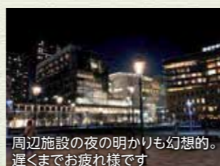
周辺施設の夜の明かりも幻想的。遅くまでお疲れ様です