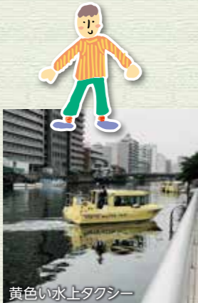
黄色い水上タクシー