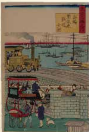
浮世絵「東京名勝之内 高輪蒸気車鉄道 全国」 歌川国輝作 明治5年(1872年) 鉄道が埋め立てた堤を走っている様子

In the Ukiyo-e "Complete Illustrations of Takanawa Steam Railway - The Scenic Places of Tokyo," the railway is shown running on a reclaimed embankment.