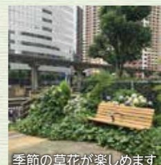
季節の草花が楽しめます