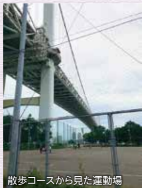
散歩コースから見た運動場