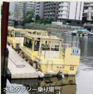
水上タクシー乗り場

なかなか珍しいので、ついジッと見てしまうスポットです。いつか乗ってみたいです。 N.O