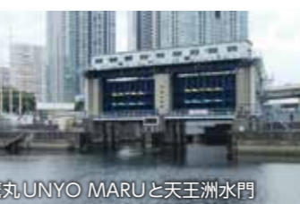
雲鷹丸UNYO MARUと天王洲水門

天王洲大橋は、首都高速1号羽田線の下を通る海岸通り、品川方面から天王洲アイル駅に行くには渡らなければならない橋です。道路なので気付かずに通り過ぎてしまうような橋ですが、天王洲運河沿の遊歩道から眺めるとその印象は変わります。天王洲大橋の手前にある天王洲水門が目に入り、すぐ横の東京海洋大学の敷地には明治42年(1909年)に建造され平成10年(1998年)に国の有形文化財として登録された帆船「雲鷹丸 UNYO MARU」に遭遇できるというサプライズのスポットです。