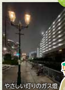
やさしい灯りのガス灯