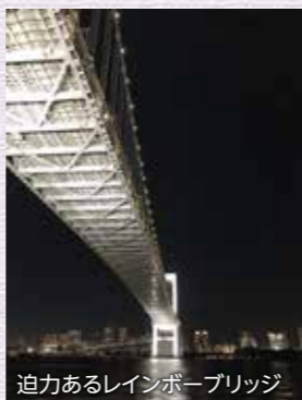
迫力あるレインボーブリッジ