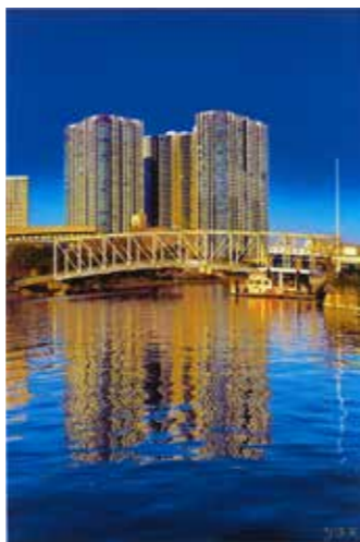
金子源さんの作品 「金色に輝く「ふれあい橋」」