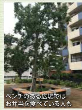
ベンチのある広場ではお弁当を食べている人も