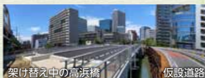
架け替え中の高浜橋