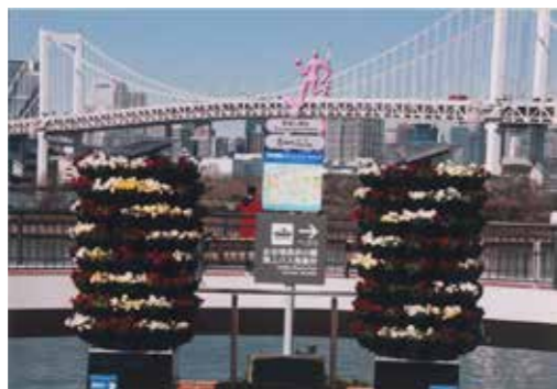
小坂 善男さんの作品 「お台場春景」