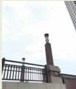
ヨーロッパ風の趣を感じられます