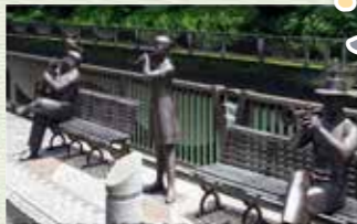
楽しそうに演奏するリバーサイドトリオ