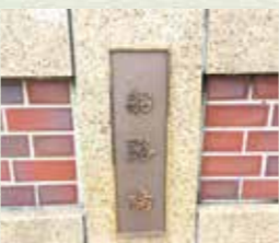
レンガ造りの橋です