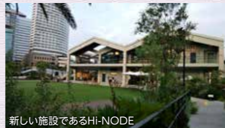
新しい施設であるHI-NODE