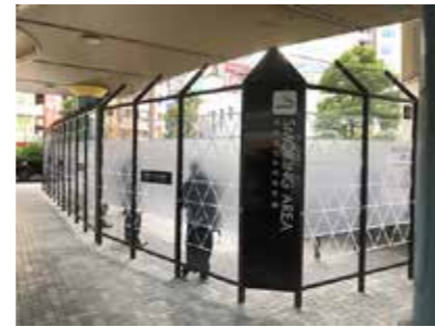
品川駅港南口港南ふれあい広場指定喫煙場所

また、従業員その他事業活動に関わる人に、みなとタバコルールを守ってもらうよう周知をお願いします。