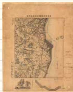
東京府武蔵国荏原郡品川宿 明治14年(1881年) 海を走る線路が描かれています