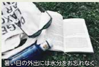
暑い日の外出には水分をお忘れなく