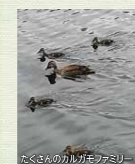
たくさんのカルガモファミリー

新型コロナウイルスのため区民の皆さんも様々な形で自粛されているかと思いますが、そんな時にぴったりの都内のオアシスを紹介します。