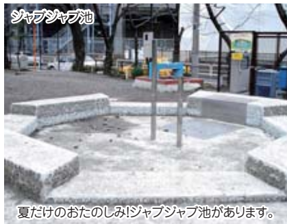
夏だけのおたのしみ!ジャブジャブ池があります。