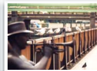
「芝浦運河モニュメント寸景」 泥谷 隆史さんの作品