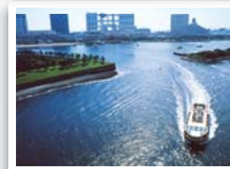
「水上バスが行く」 小坂 善男さんの作品