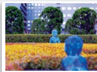
「遊び好きの子供たち」 コッフマン ポールさんの作品