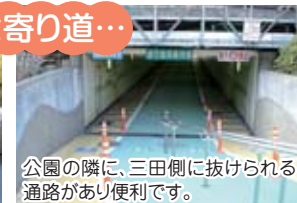
公園の隣に、三田側に抜けられる 通路があり便利です。