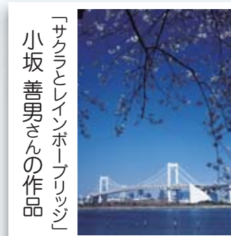
「サクラとレインボーブリッジ」 小坂 善男さんの作品