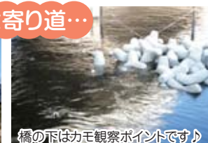
橋の下はカモ観察ポイントです!