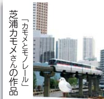
「カモとモノレール」 芝浦カモメさんの作品

編集部では表紙、読者ギャラリーの作品 [写真・俳句・イラストなど]を募集しています。