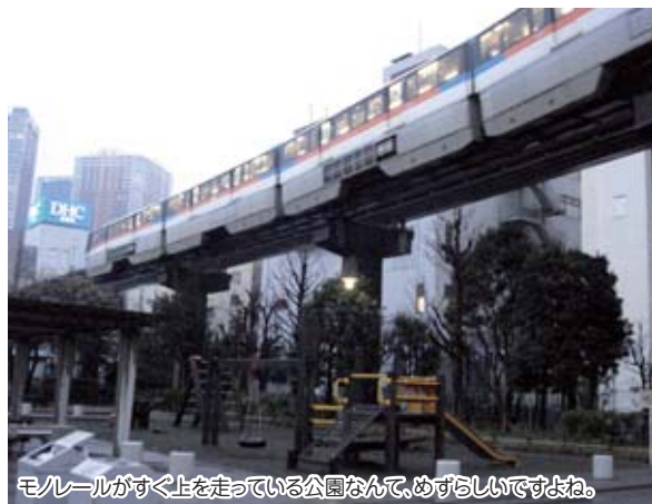
モノレールがすぐ上を走っている公園なんて、めずらしいですね。