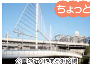
公園の近くにある浜路橋