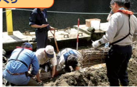
深みを作ったり「そだ(伐採した木の枝)」を入れたりしてもっとすみよい環境に

平成18年5月に、芝浦運河ルネッサンス協議会や運河を美しくする会が中心となり、「カニ引越大作戦！」が行われた「カニ護岸」を覚えてますか？国土技術政策総合研究所、東京都港湾局と港区ベイエリア・パワーアッププロジェクト第1分科会と区民の皆さんが協力して、この護岸で「海の生き物のすみかづくり」プロジェクトを進めています。整備された護岸に人工につくられた干潟の観察・調査や勉強会を継続して行いながら、芝浦運河をもっと生き物たちにとって暮らしやすい環境にしようという取り組みです。皆さんも、ちょっと運河をのぞいてみてください。意外と水がきれいで、大きな魚が泳いでいたり、水鳥もいます。生き物たちであふれている運河は、私たちにとって心む環境です。みんなで生き物にやさしい、きれいな運河にしていきたいと思います。