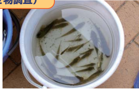
こんなにつれたよ、芝浦産ハゼ