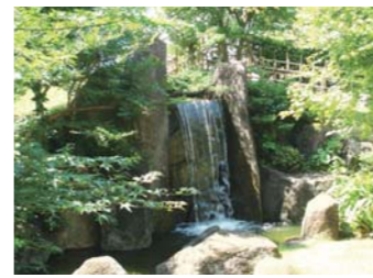
再生センター内の処理水利用の人工の滝