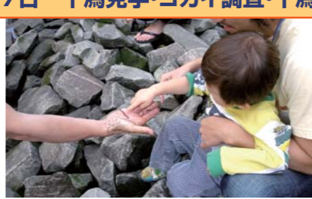
土に栄養があるとたくさんいる「ゴカイ」