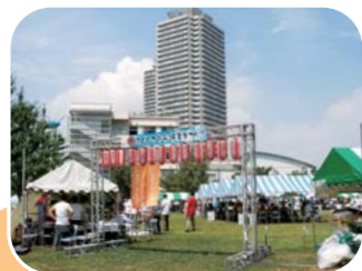
快晴のもと、夏まつりの始まりです