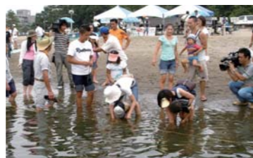
アマモにくくりつけた割り箸をしっかり埋めてね