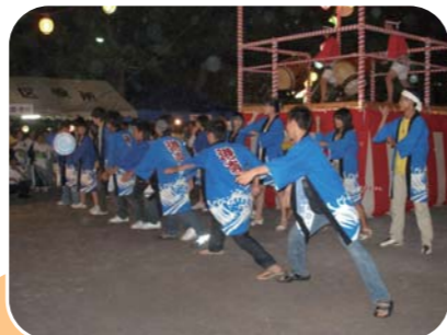
港南中学校の皆さんの熱演