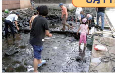
前回と比べて生き物増えた？