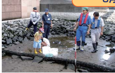
水を抜いた干潟「何があるかな？」