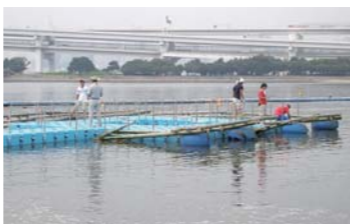
観察浮体に「カキいかだ」を設置