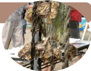
カキをロープに結び付けた「カキ連」

1個のカキが1日にろ過する海水は約400リットルと言われています。そのカキを使って、東京の海をきれいにする取り組みです。そのほか、ナマコ、アマモ、アオサといった多様な生物、植物の複合的な作用によって、多くの魚が泳ぐ姿が見られるような、きれいな海への再生をめざします。8月28日に、この実験施設のパーツをみんなで一緒に作成するイベントが開催されました。参加者は宮城県のカキ養殖のプロの方々による「カキいかだ」づくりを見学したり、タッチプールでお台場の魚たちにさわってみたり。また、実際にアマモを植えたり、カキをロープに結び付けて作った「カキ連」を「カキいかだ」に吊るす作業も行いました。この実験施設では、今後も実験状況イベントを行う予定です。みんなでこのイベントに参加し、ひとりひとりが海の環境に関心を持ち、海をきれいにすることを考えていきましょう。