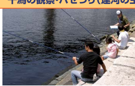
たくさんつれるといいな