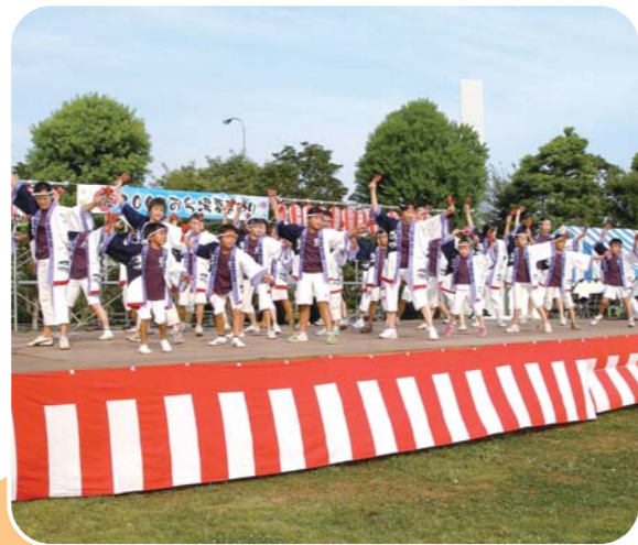
お台場よさこいチーム「凧」の皆さん

8月25日に、お台場夏まつり2007がお台場レインボー公園で行われました。今年も、地元の皆さんや地元企業・団体の皆さんの協力により、盛大に実施されました。ステージ上では、お昼から夕方まで、ダンス、和太鼓演奏、コーラスなどの演目が途切れることなく続き、夜は盆踊りでフィナーレとなりました。