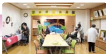
仲間の力作に感心したり、触発されたり