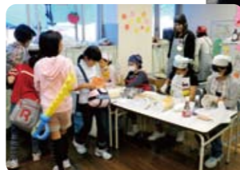
子ども達による模擬店