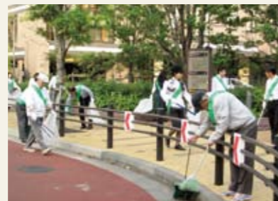
地域住民と地元企業で協力して道路清掃