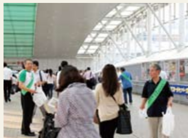
みなとタバコルール啓発品配布の様子