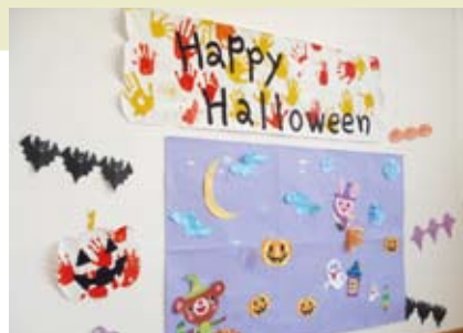
今日はハロウィンイベントの日!