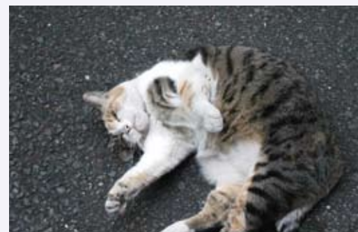
肉球らぶさんの作品 「人懐っこい運河の野良ネコ」