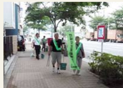
清掃しながら、防犯パトロールも実施