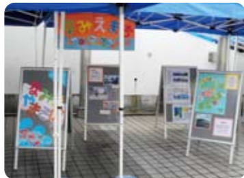
大好評だった浪江やきそば

10月22日、子どもたちが、企画・運営する児童館まつりが開催されました。今年は名称をNICO×2(にこにこ)まつりとし、みんなで元気に楽しく盛り上がりました。定番の模擬店に加え、スポーツチャンバラ屋やスピードガン計測などユニークな出展があり、芝浦・港南地域からもたくさんの方が訪れ、1,000名近い来場者が、にこにこ顔でおまつりを楽しみました。B級グルメ