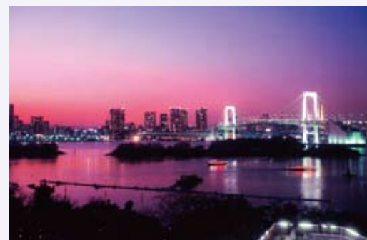
小坂 善男さんの作品 「お台場の夜景」