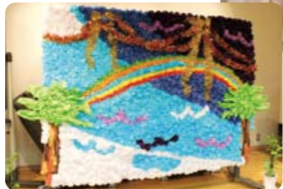
デイサービス・ふれあい団らん室の利用者が作ったお台場の虹

10月19・20日の両日、芝浦アイランド児童高齢者交流プラザ、港南いきいきプラザ、台場高齢者在宅サービスセンターの3会場で「ほのぼの作品展」が開催されました。手芸や書道、絵画、文芸、写真など、各施設の利用者を中心とする方々の力作が勢ぞろい。今年は東日本大震災を受けて、復興への願いが込められた作品も見受けられました。