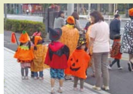
にぎやかな格好に道行く人も笑顔に