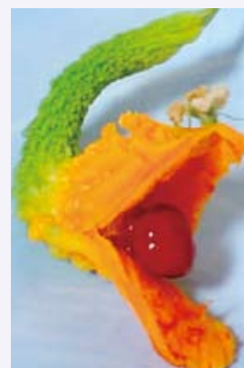
台場 にじ子さんの作品 「ゴーヤの珍顔」