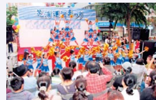
泥谷 隆史さんの作品 「クライマックス」