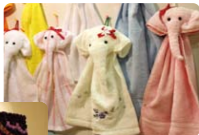
東北の復興を願って、タオルの「がんばる象」